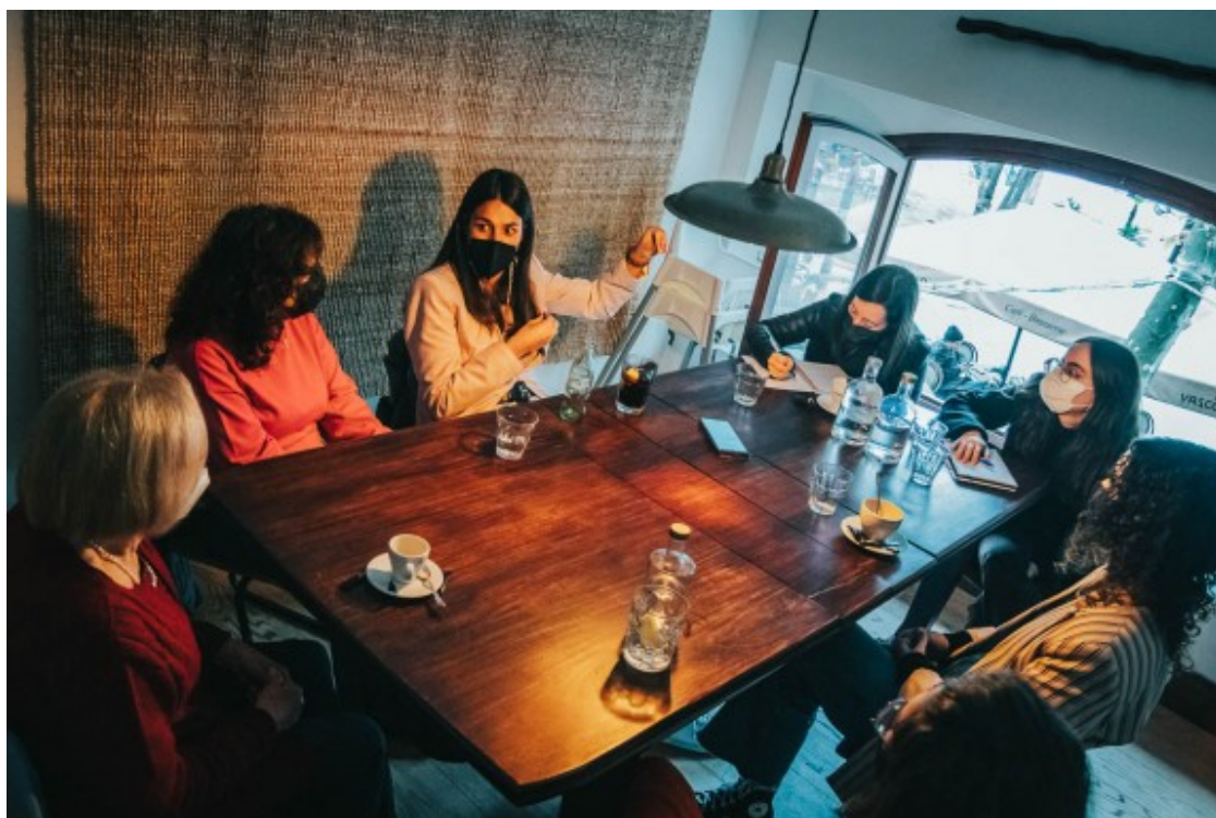
Les cinc dones que participen en la conversa amb NacióDigital

No riure bromes masclistes, no enviar fotos als amics de dones despullades, deixar de veure pornografia amb continguts violents, no menystenir-les, respectar el seu espai quan caminen pel carrer. No externalitzar sempre la culpa. No ser part activa dels mal anomenats "micromasclismes" que són la base que sustenta una estructura de violència contra les dones. "No ho han patit, no canviaran així com així", lamenta la Fina. "Per a ells no és opressió, és normalitat", afegeix l'Anna. I la Usoa ho resumeix així: "Jo els diria que es possessin 24 hores en el cos d'una dona per saber de què estem parlant".