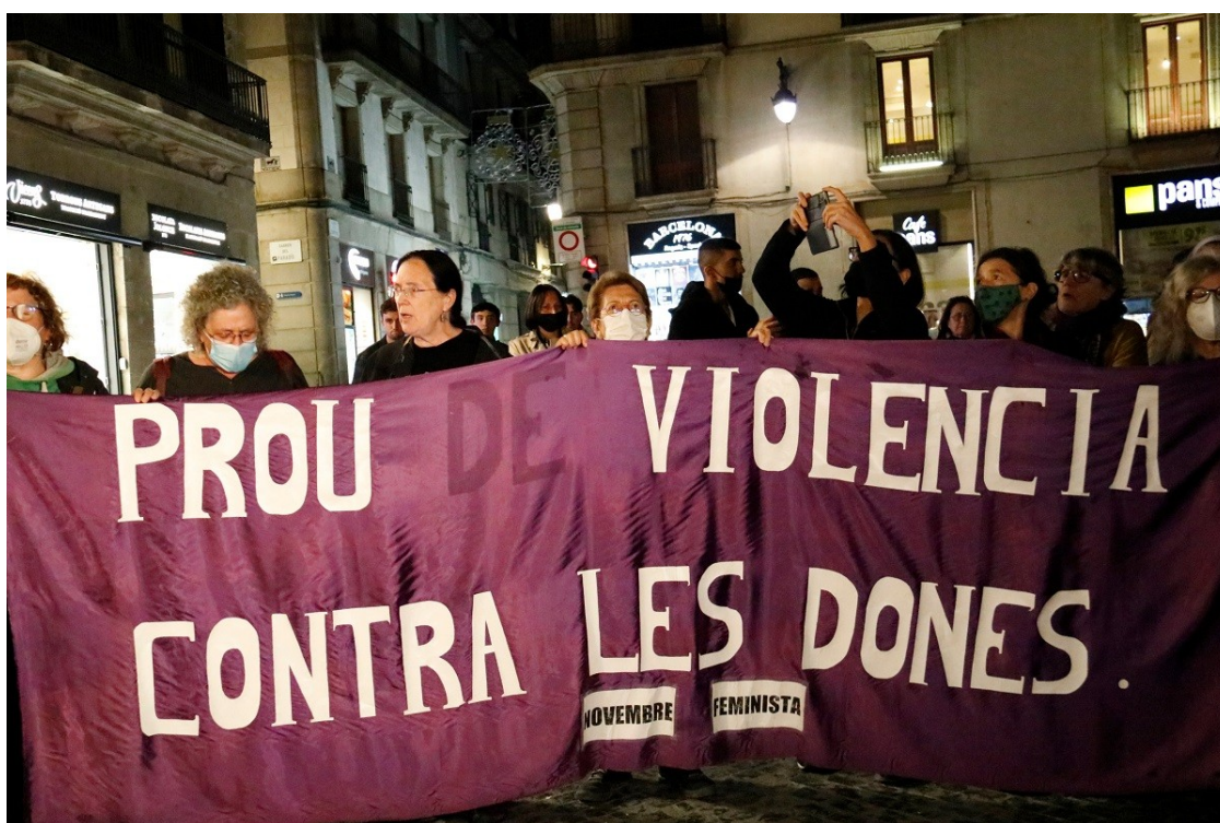
Manifestació per condemnar l'agressió a una menor.

Les expertes assenyalen que en més del 80% dels casos els agressors són coneguts de la víctima i que hi ha conductes socialment "normalitzades" per falta d'una educació socio-afectiva que trenqui rols de gènere