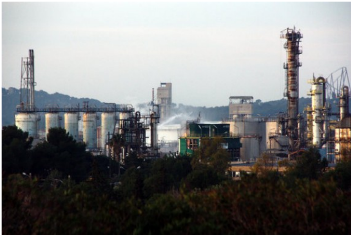
Imatge d'arxiu de la planta d'IQOXE, després de l'explosió