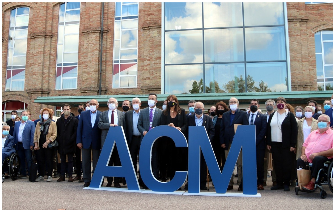
Foto de grup un cop finalitzat l'acte de commemoració del 40è aniversari de l'ACM

La presidenta del Parlament ha destacat que el municipalisme és la "clau de futur" del país i n'ha lloat la unitat