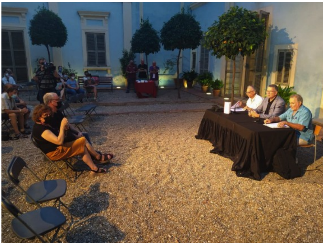
La presentació del llibre es va fer ahir al jardí de la Casa Canals.

- El ball de la Sogra i la Nora no és tan conegut perquè no es representa i no hi ha notícies que s'hagués representat periòdicament, com era el cas de Dames i Vells, abans de la Guerra Civil. Del ball de la Sogra i la Nora només hi ha un text que tenien a l'Arxiu de l'Arquebisbat, que no té data però per la caligrafia podem dir que seria de finals del segle XIX. En aquest ball no podem contrastar allò que ha anat canviant.