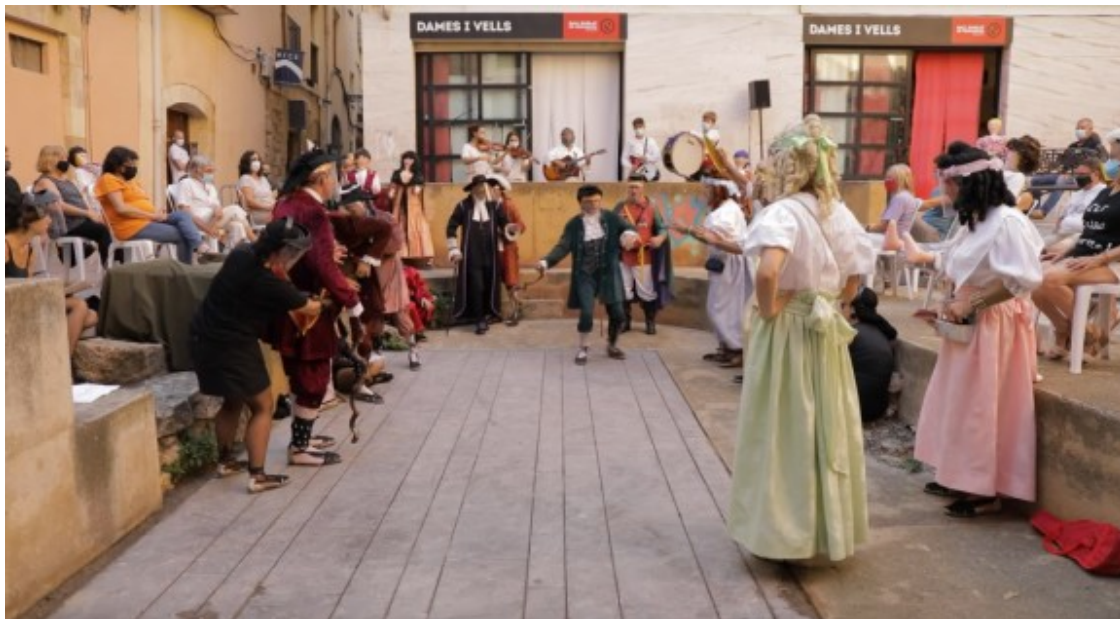
Dames i Vells.