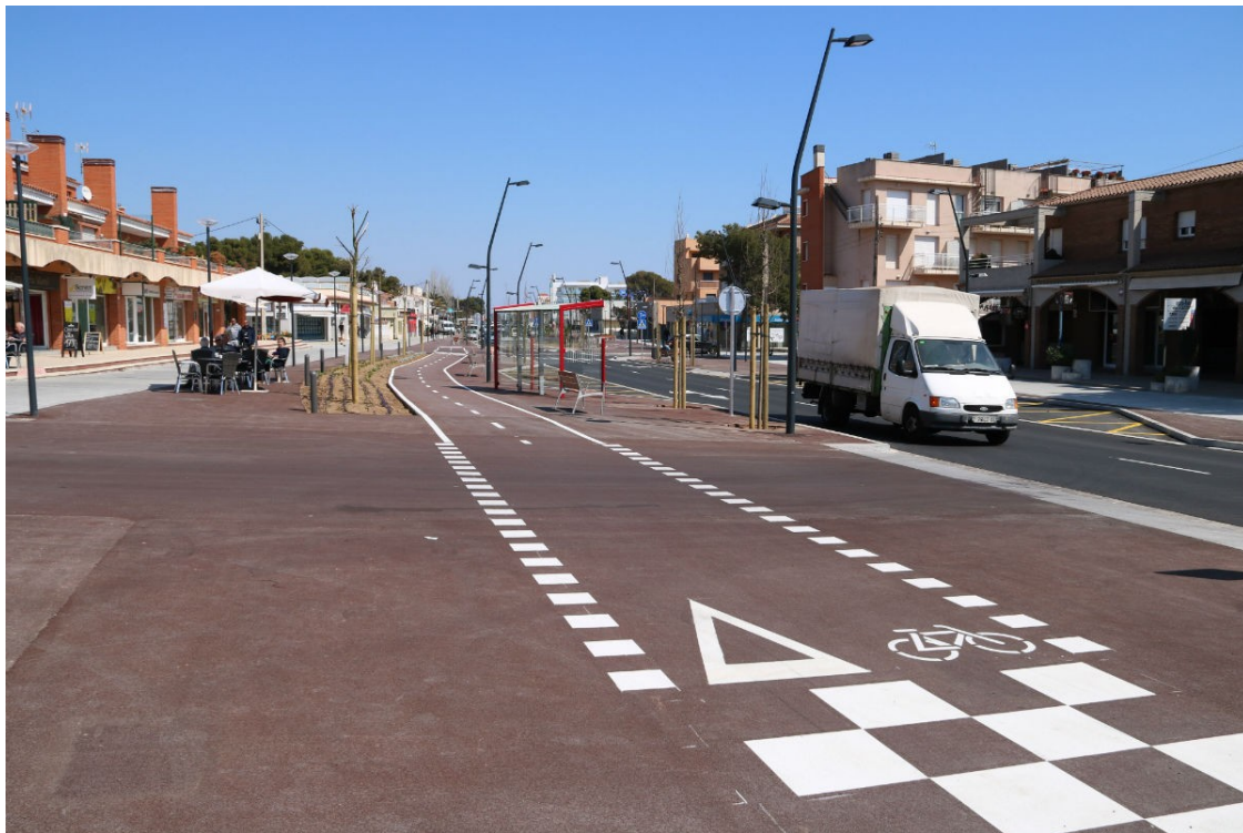
L'avinguda Barcelona de Miami Platja.

Es manté la celebració de la Fira, a l'agost