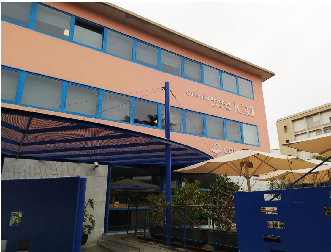
La seu de l'Il·lustre Col·legi de l'Advocacia de Tarragona (ICAT).