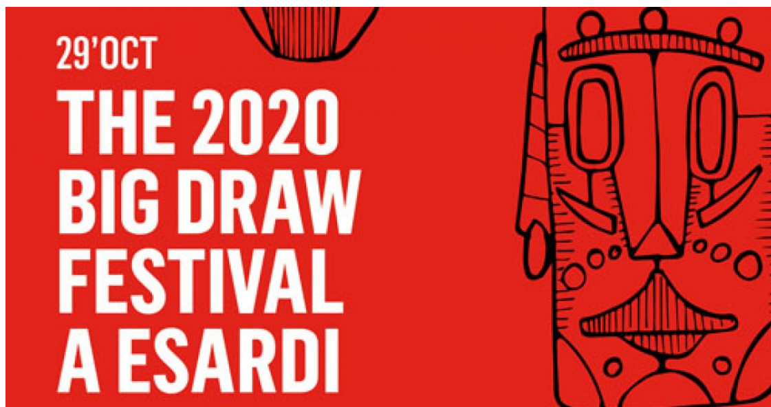
Cartell del festival internacional de dibuix BigDraw