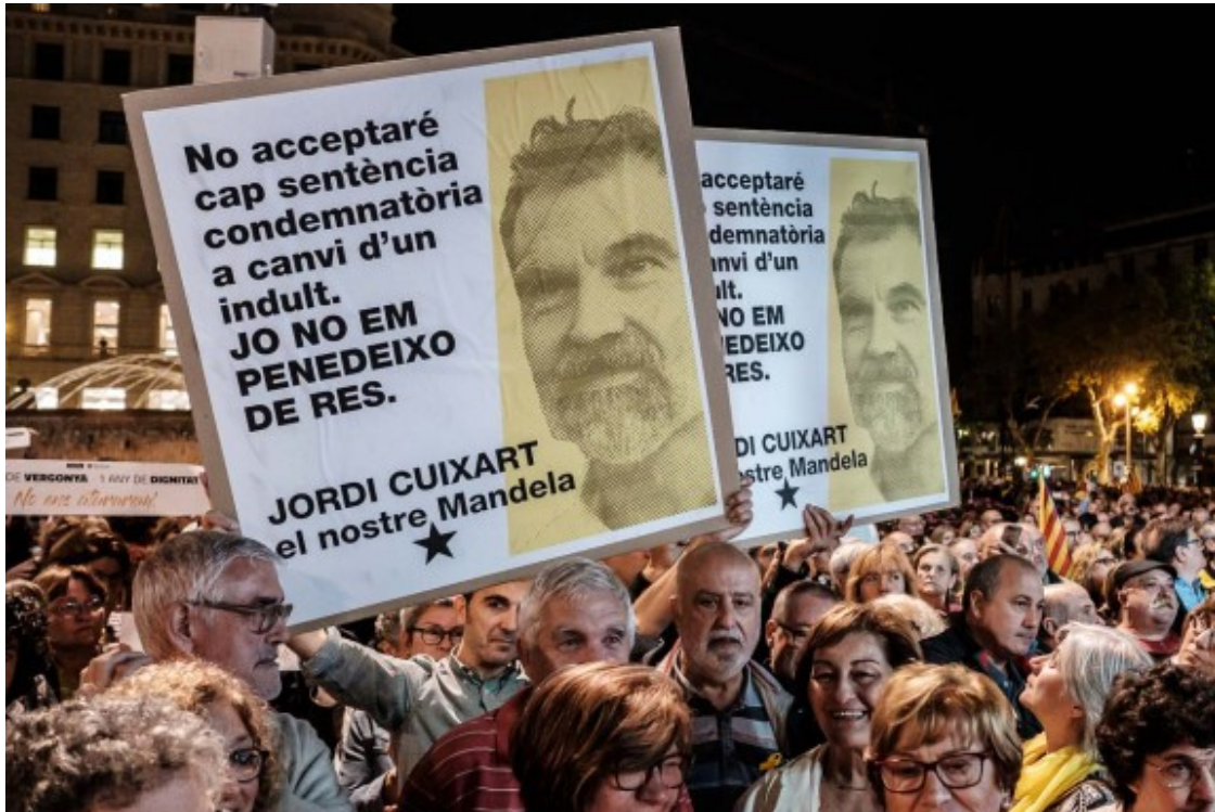
Cartells amb el rostre de Jordi Cuixart, en una manifestació a plaça de Catalunya.

estèrils, com quin paper havia de jugar cadascú a la manifestació. Ara cal tenir-ho present. Si passa el mateix que el 2010, pot succeir que tot canviï al voltant dels partits. El que no canviarà és la societat catalana. La sentència serà una prova de foc per als partits polítics. Més enllà dels pactes, caldrà respondre atenent aquestes grans majories. S'ha acabat el temps de les ambigüitats: la inacció els passaria factura.