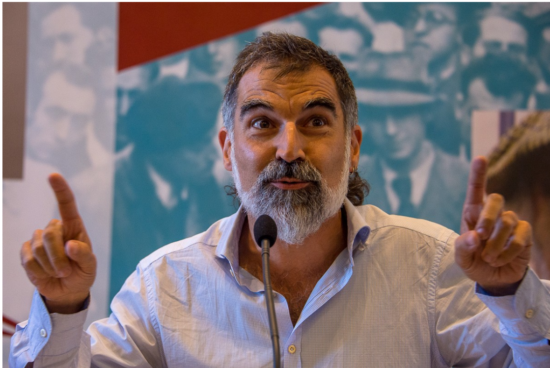
Jordi Cuixart en una imatge d'arxiu

El president d'Òmnium recomana "regar les relacions" per no reproduir xocs com els dels pactes postelectorals i sosté que el comportament de Sánchez amb Catalunya s'explica perquè sap que a Espanya "no el penalitzarà"