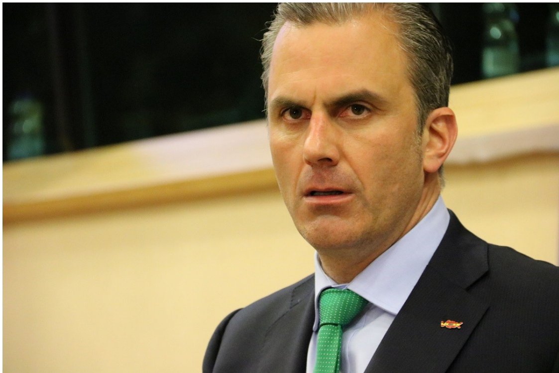
Javier Ortega Smith, secretari general de Vox.

El magistrat considera que hi ha indicis d'un presumpte delictes de discriminació