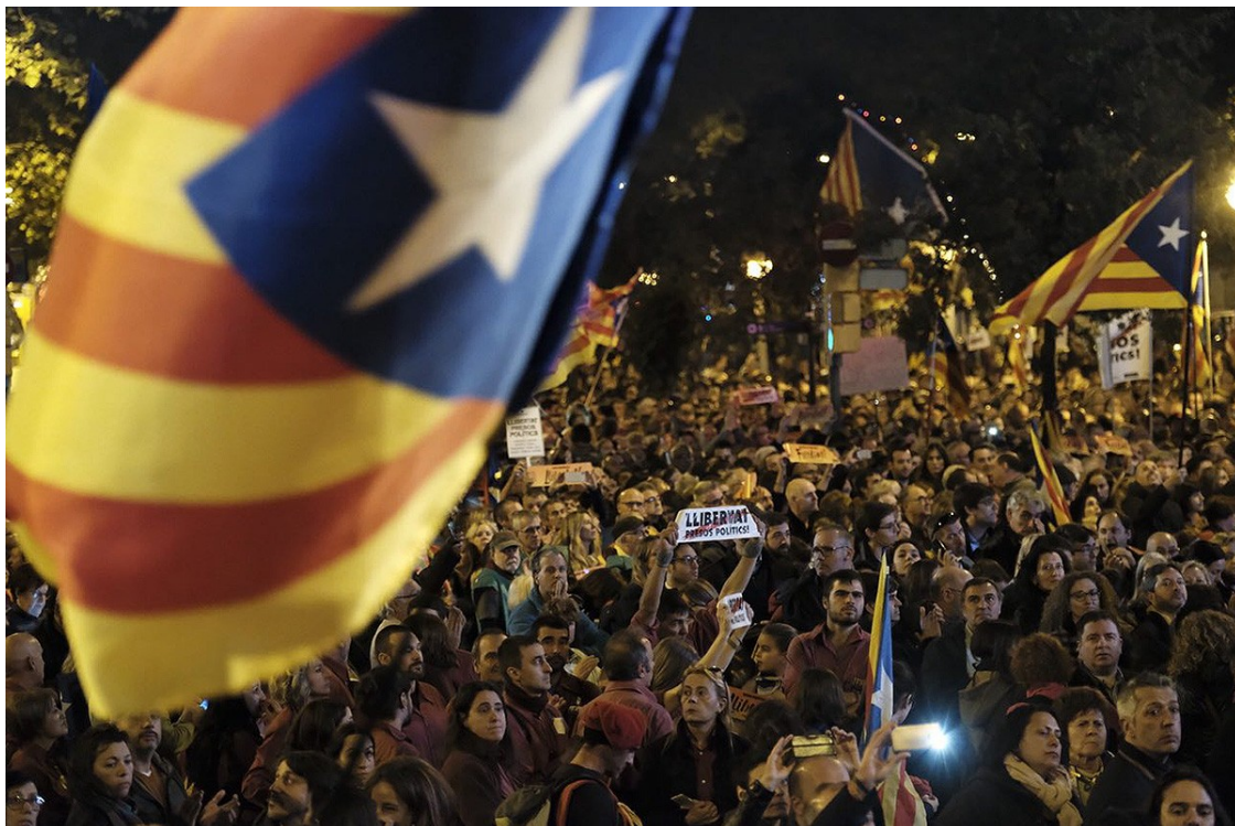
La manifestació a Barcelona en suport als presos polítics

Les entitats demanen mostrar a la UE i al món la "determinació" per "continuar la lluita per la plena democràcia" amb una gran mobilització al cor d'Europa