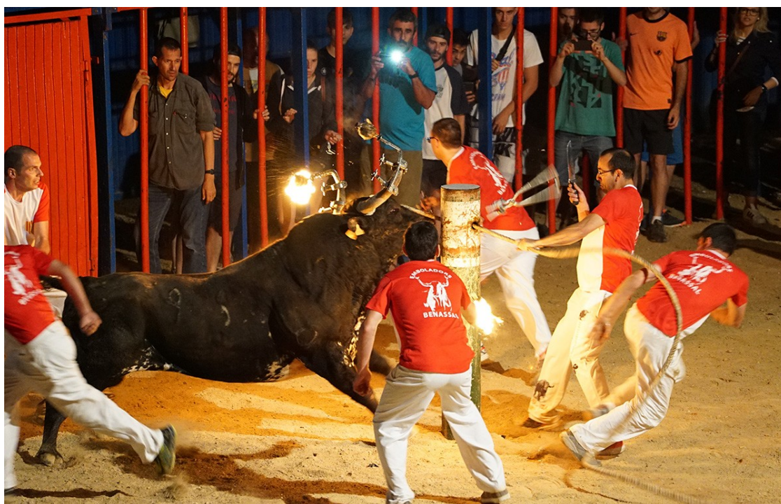
Imatge del concurs d'emboladors celebrat el 25 de juny de 2016.

AnimaNaturalis va denunciar "l'endarreriment de l'espectacle sense justificació aparent", i el fet que no s'evités "els maltractaments i el sofriment" dels animals durant un concurs d'emboladors