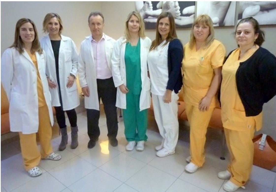
Equip d'Embriogyn.

Embriogyn va obrir les seves portes l'any 2006 | És l'únic centre especialitzat de forma exclusiva en Reproducció Humana Assistida