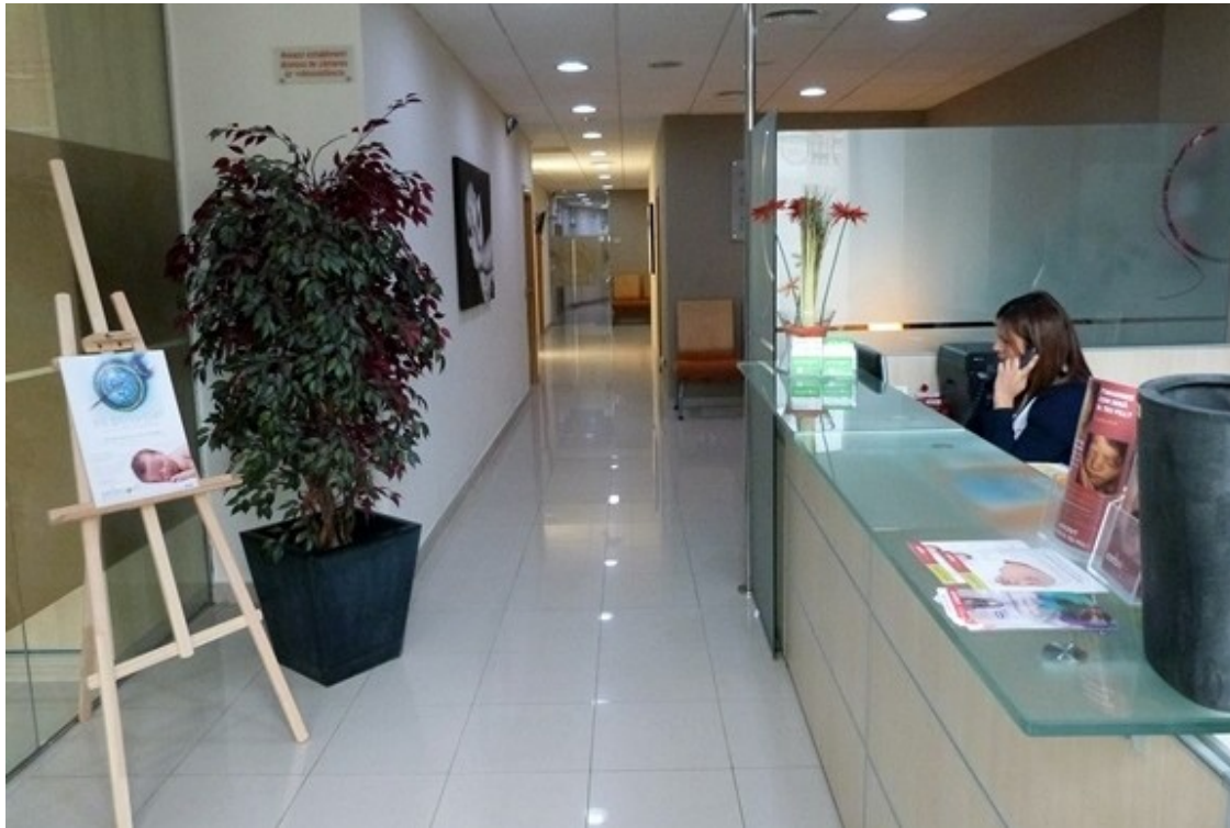
Recepció d'Embriogyn.

Molt interessant també és el llibre que Embriogyn ha editat sobre experiències de pacients que han passat per un procés de reproducció assistida, titulat Vull tenir un fill . El llibre es pot demanar gratuïtament a la clínica i una part la podeu consultar a la web www.experienciesreproduccioassistida.com ( http://www.experienciesreproduccioassistida.com ) .