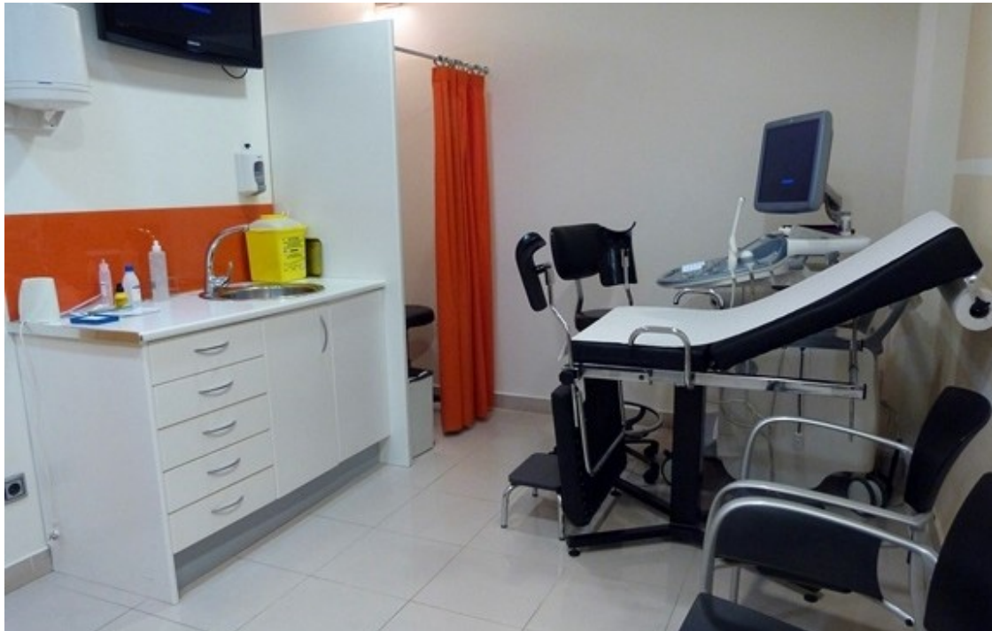
Embriogyn.