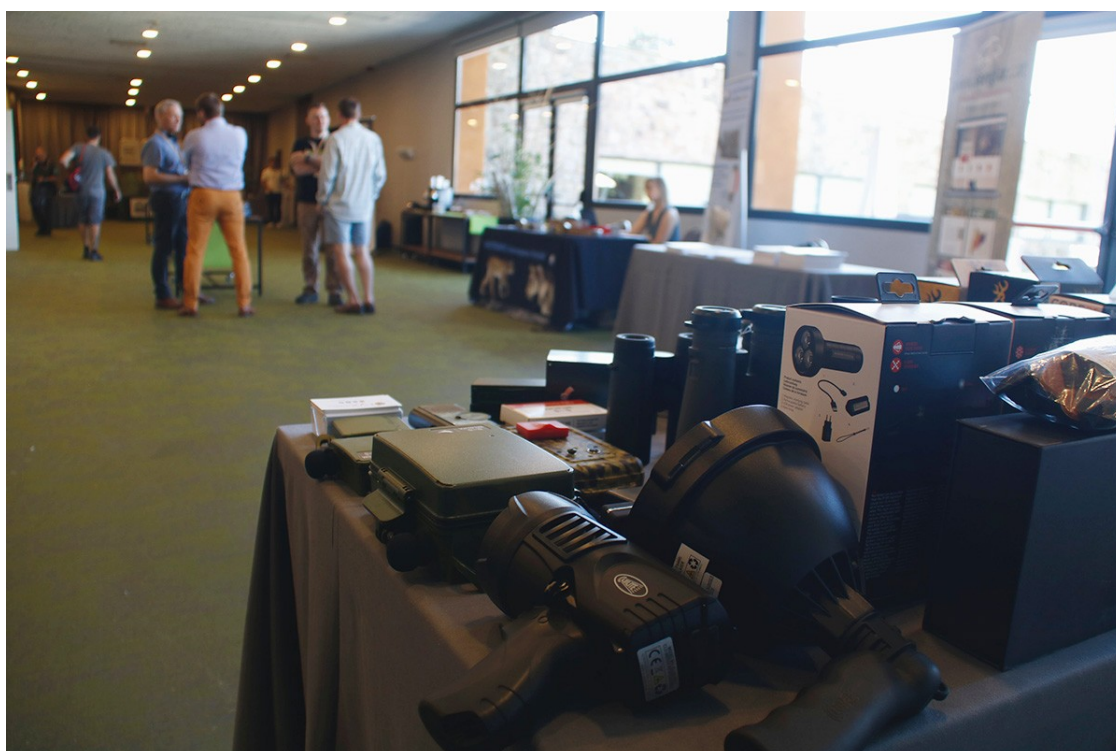
Material per controlar senglars i experts al fons durant el congrés a Seva.

El Departament d'Acció Climàtica confia que les negociacions es desencallaran en els propers dies