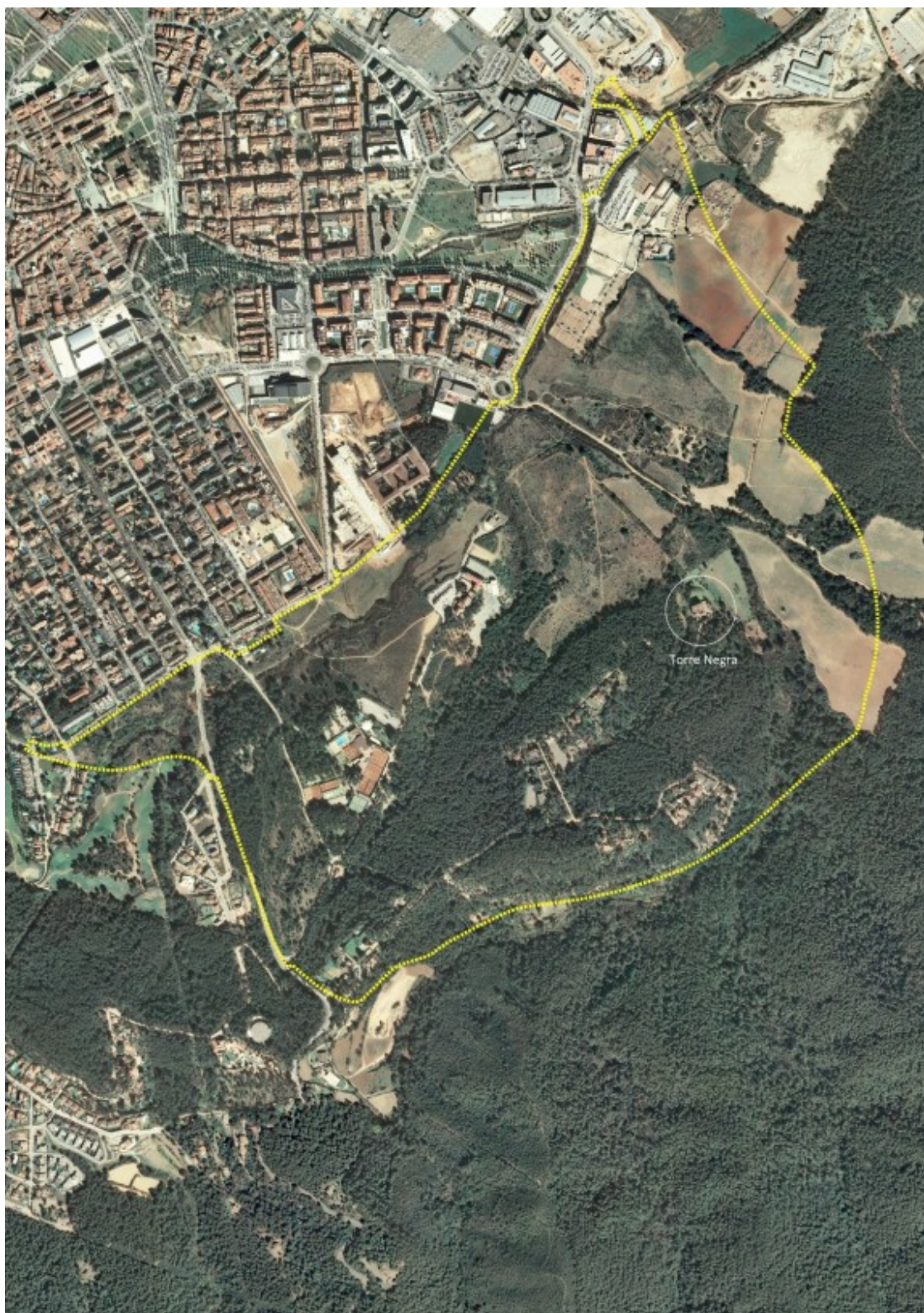
Plànol de la modificació urbanística de l'àmbit de Torre Negra en sòl no urbanitzable