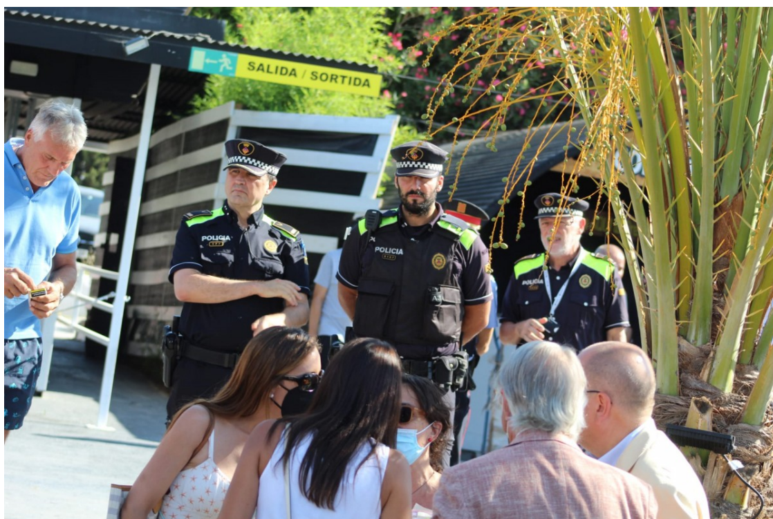
Imatge durant el desnonament de la discoteca Drinking Lemon

L'empresa concessionària dels terrenys deu prop de 4,5 milions d'euros a l'Ajuntament de Sant Cugat en concepte de cànon