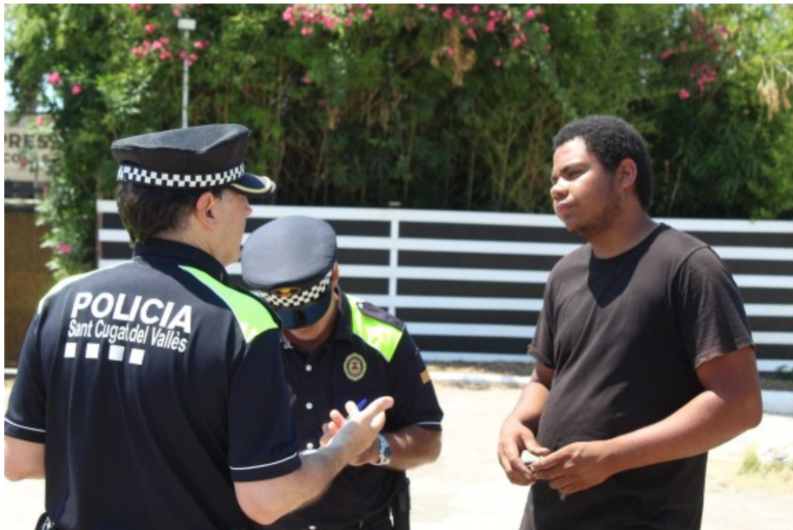
El noi que vivia a l'interior de la discoteca fent tasques de vigilància