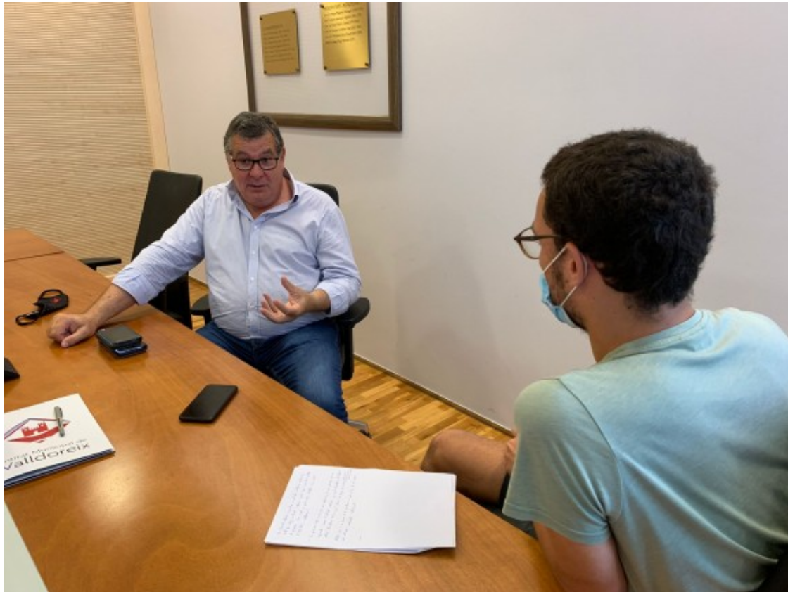
Puig nega que hi hagi voluntat de boicot des del tripartit de Sant Cugat, malgrat que "a vegades ho pot semblar"

Pel que fa a les paraules de Margineda, una persona de la pròpia CUP va estar parlant amb mi per explorar si era possible implementar-ne una al barri sancugatenc de la Floresta. Una proposta que al final es va descartar perquè no era viable. I ara apareix Margineda i pixa fora de test reclamant més centralitat per a Sant Cugat. O no sap el que diu o no s'enterra. El que hauria de fer és deixar la seva vocalia per un altre membre del seu partit i renunciar al seu sou tenint en compte que és evident que no té gaire afecte per l'administració local ni el que representa.