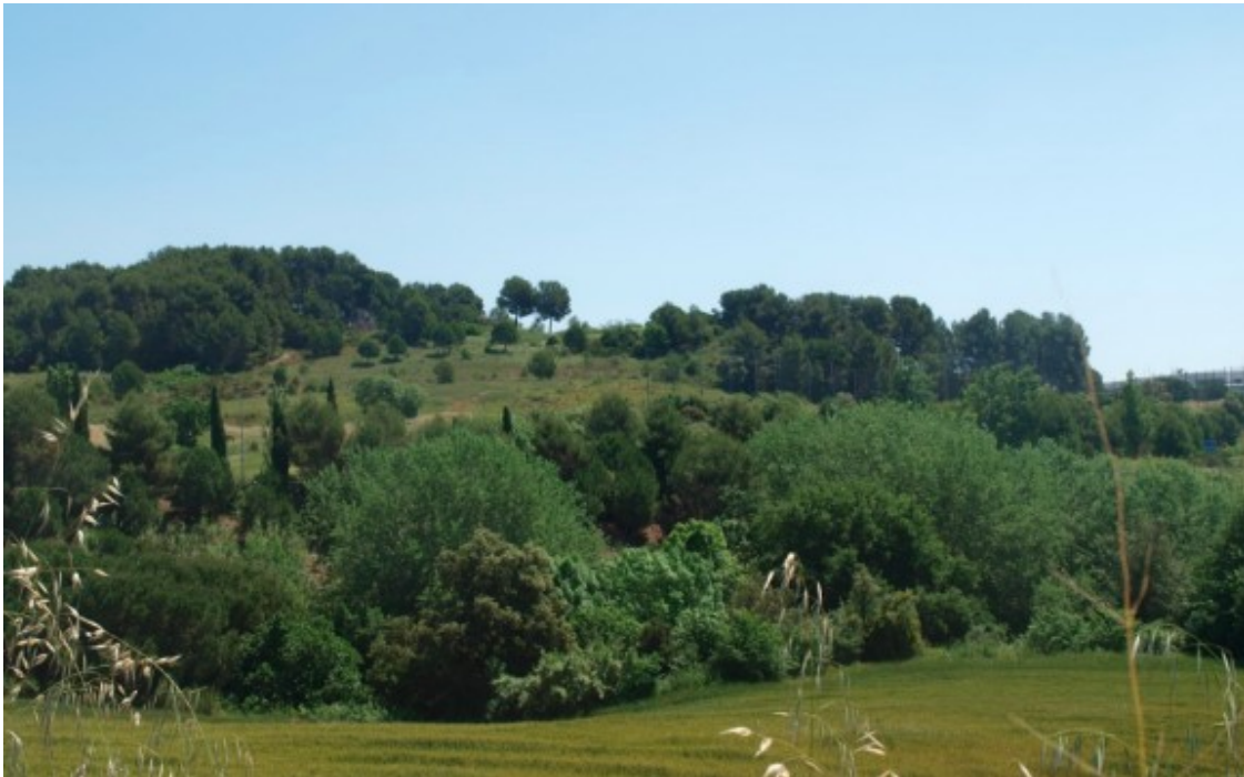
Un espai per contribuir al fre de l'emergència climàtica