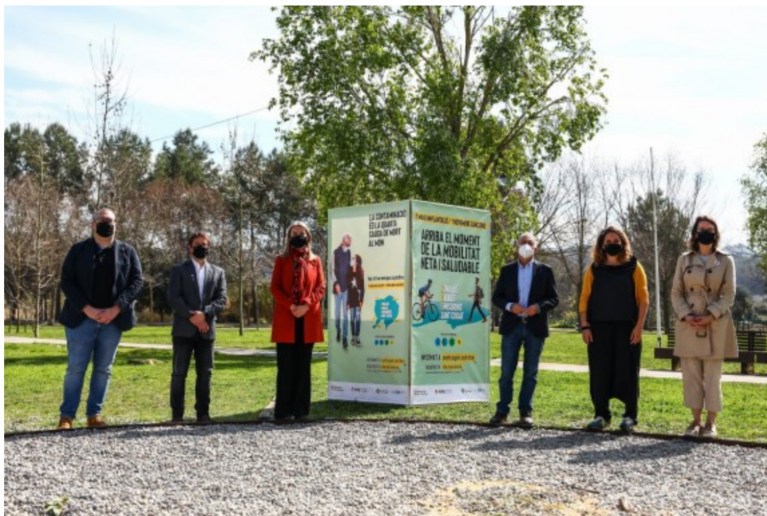
Presentació de la Zona de Baixes Emissions de Sant Cugat.