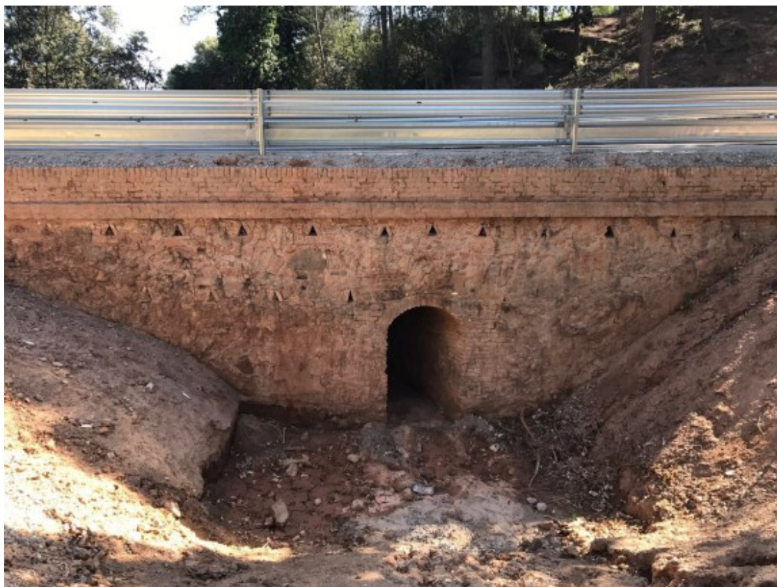
El pont del Camí de la Salut de Valldoreix

L'EMD ha aprovat inicialment la convalidació del projecte de restauració del pont del Camí de la Salut amb un pressupost de 63.000 euros que ha estat redactat pels serveis tècnics del Consorci del Parc Natural de Collserola i que assumiria l'Ajuntament de Sant Cugat com a partida reservada.