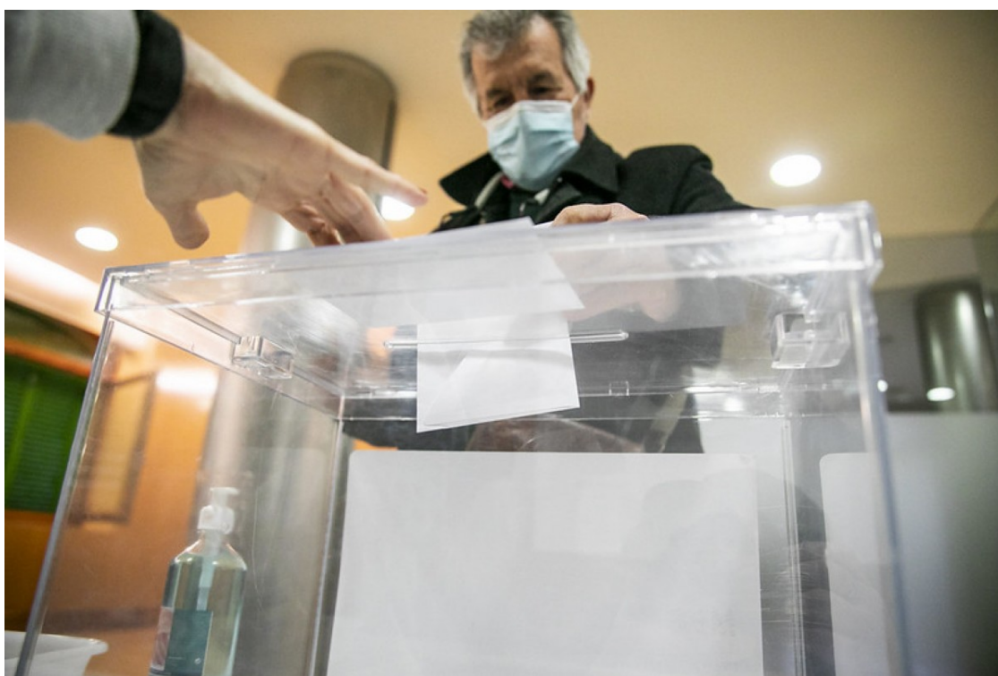
La jornada electoral del 14-F a Sant Cugat

Vox ha arrasat en una àrea de la ciutat amb prop d'un 20% dels vots