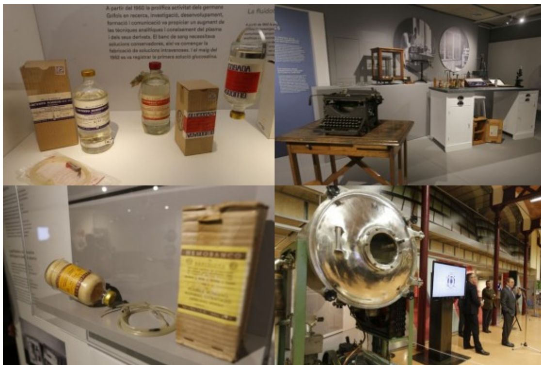
Una exposició de material històric de Grifols a Terrassa.