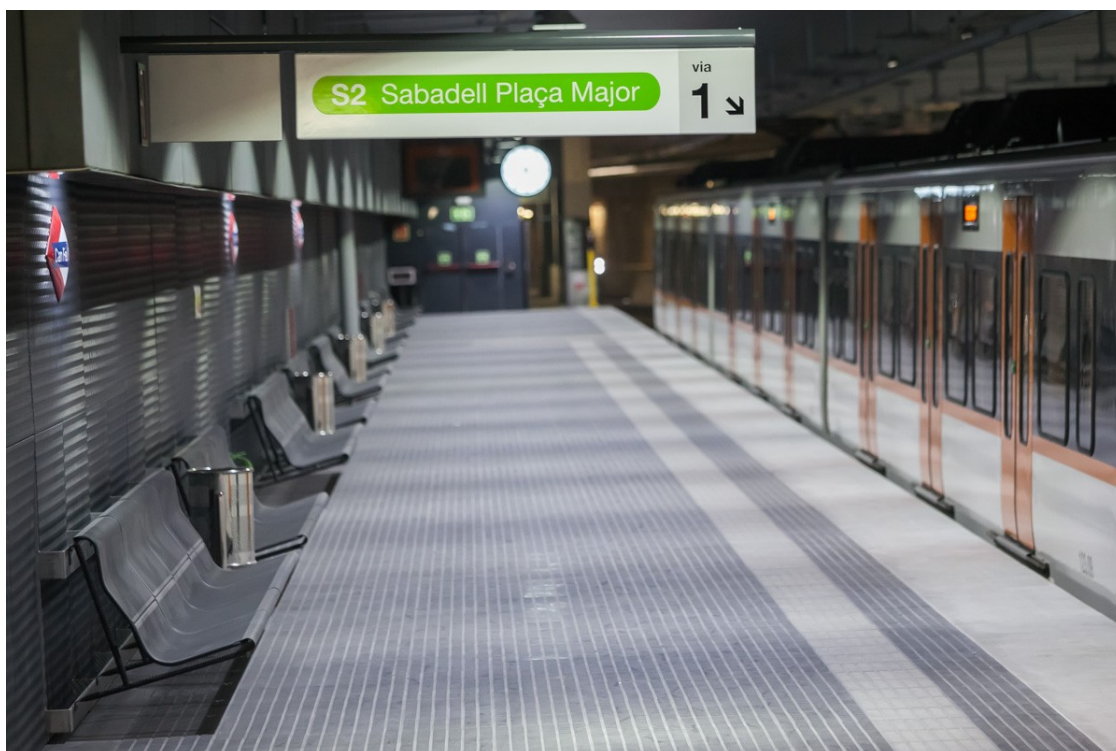
Andana de la nova estació Can Feu - Gràcia, a Sabadell | Juanma Peláez

Les dues noves estacions de la capital vallesana s'inauguraran el 12 de setembre | El primer tren que circularà es dirà Joan Oliver