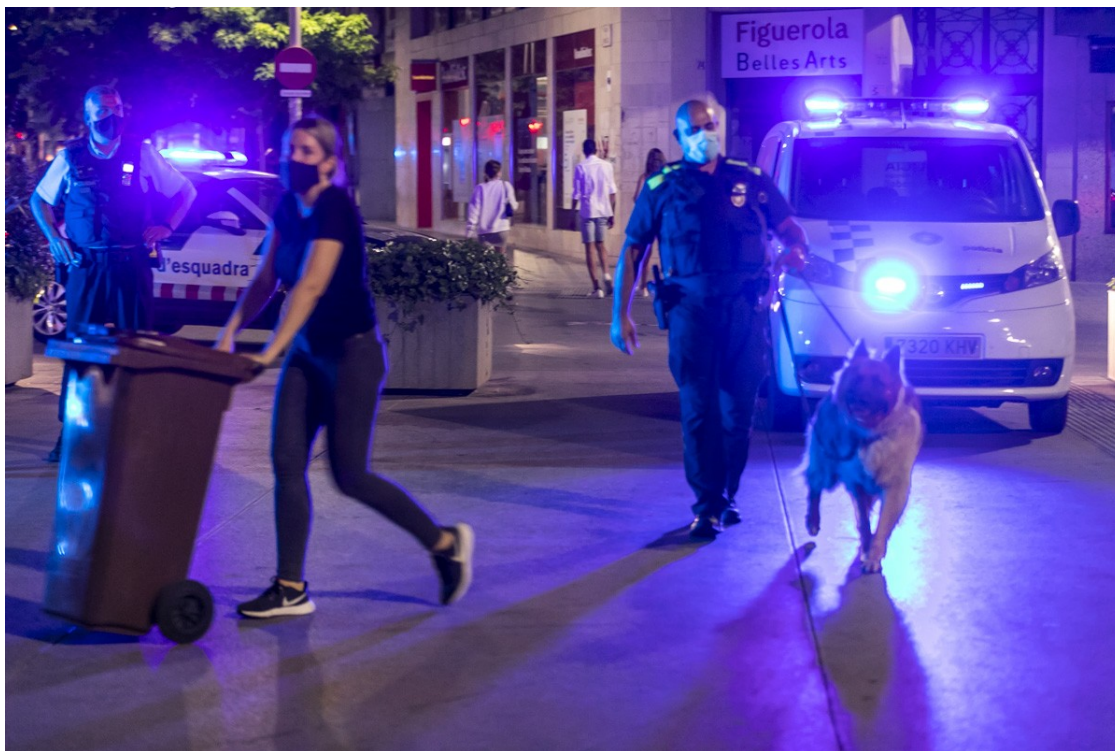
Un agent de la Unitat Canina | Juanma Peláez

El consistori està estudiant si presentarà recurs a la sentència