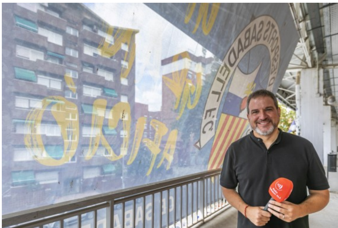
Garcés a la Nova Creu Alta.

- A nivell d'equips modestos, per dir-ho d'alguna manera, sincerament, no ho sé. Segurament hi haurà algun company, igual que fem amb el Sabadell, com pot ser, per dir algun, l'Alcoià. Després ja estan els que segueixen Barça i Madrid. Això ja és un altre nivell.