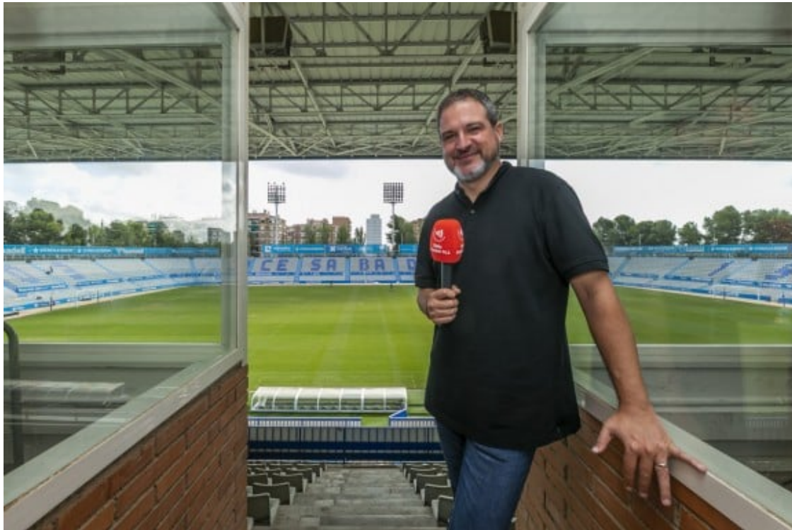
La cabina des d'on narra els partits.