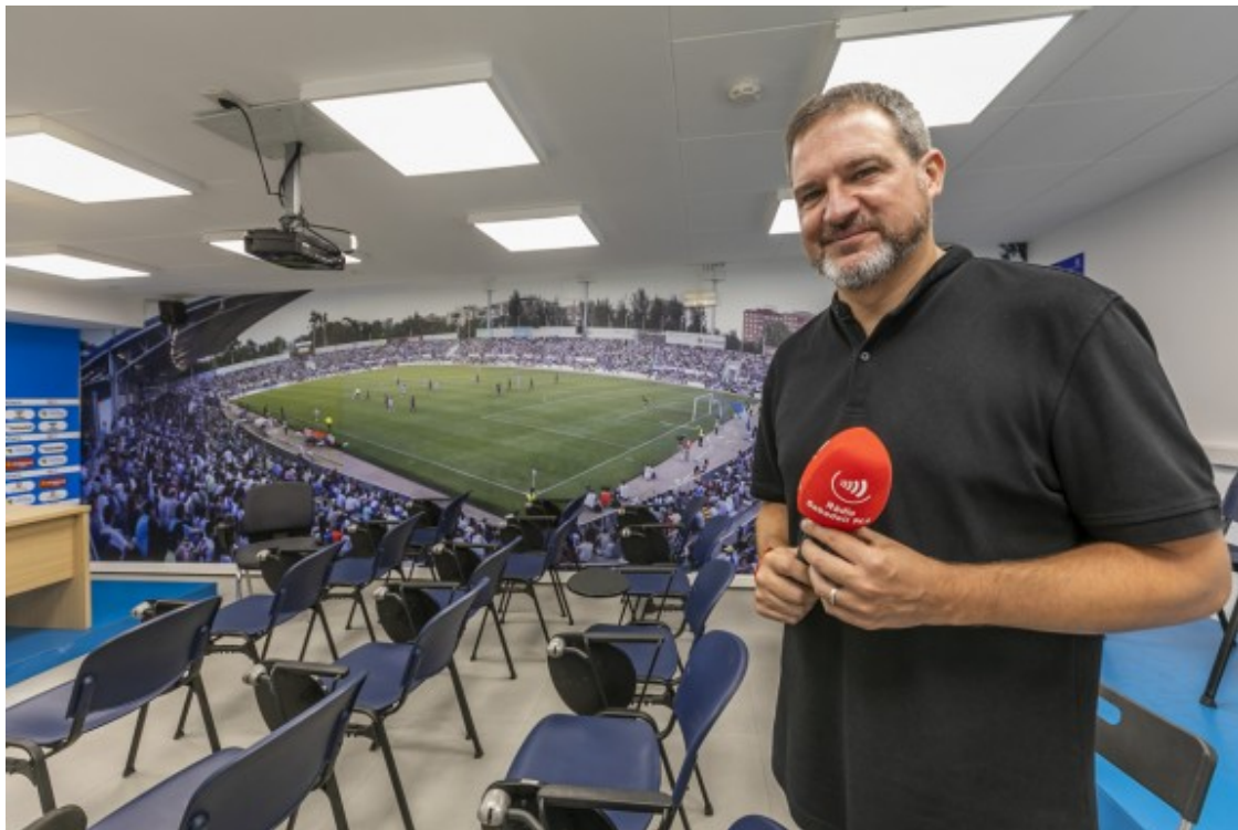
La sala de premsa del CE Sabadell.

- Ara que deia això de "professionalitat". Un professor de periodisme esportiu de la facultat deia que s'havia de "penjar la bufanda" en aquest ofici. Es pot aplicar als mitjans locals?