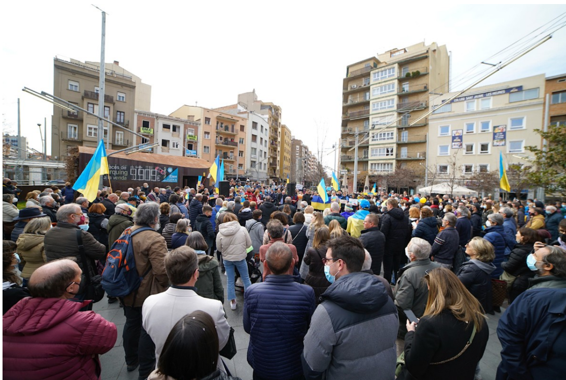
Concentració a Lleida contra la guerra a Ucraïna.

És una de les 13 ciutats catalanes que més en té; el Vallès Occidental és la segona comarca més poblada per ciutadans d'Ucraïna