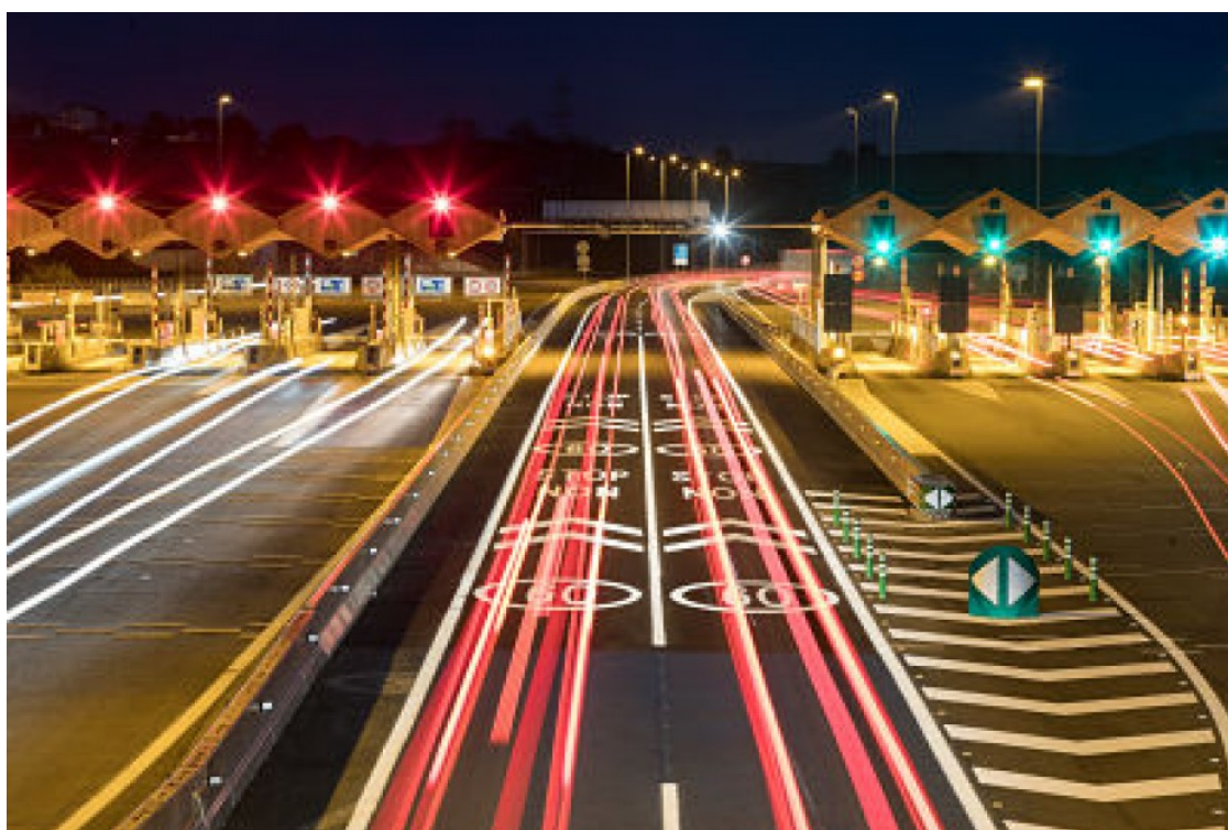
El peatge de l'AP-7 a la Roca

Els alcaldes avisen que en alguns casos perden entre un 10% i un 20% del pressupost local i reclamen compensacions