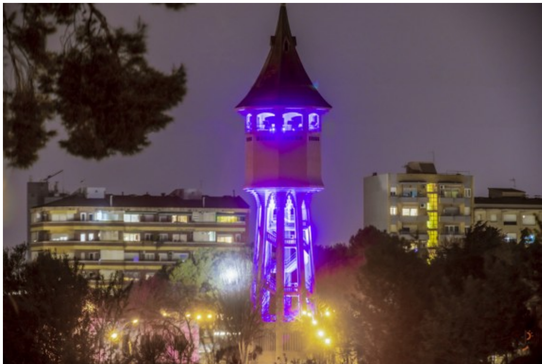
La Torre de l'Aigua, de lila

Era una de la trentena d'activitats previstes en l'agenda que s'està desplegant des de febrer i que ha tingut com a epicentre aquest dilluns. Les cites, però, continuaran els propers dies.