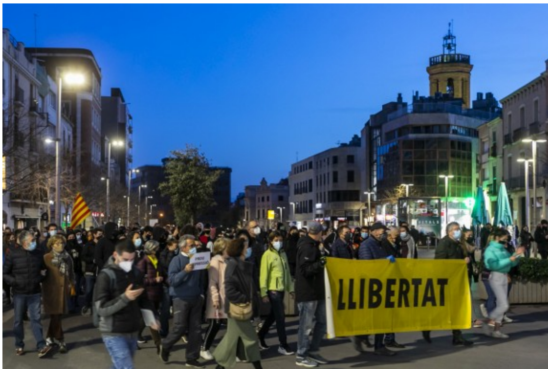
La mobilitació pel Passeig