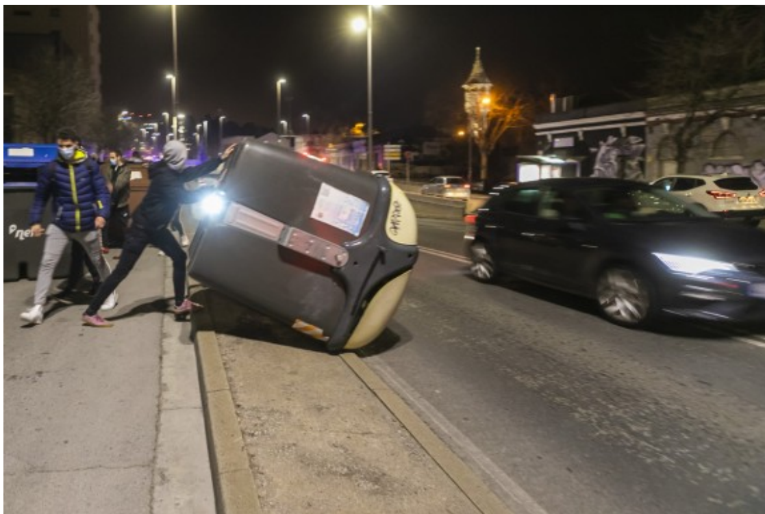
Un dels manifestants manipulant un contenidor