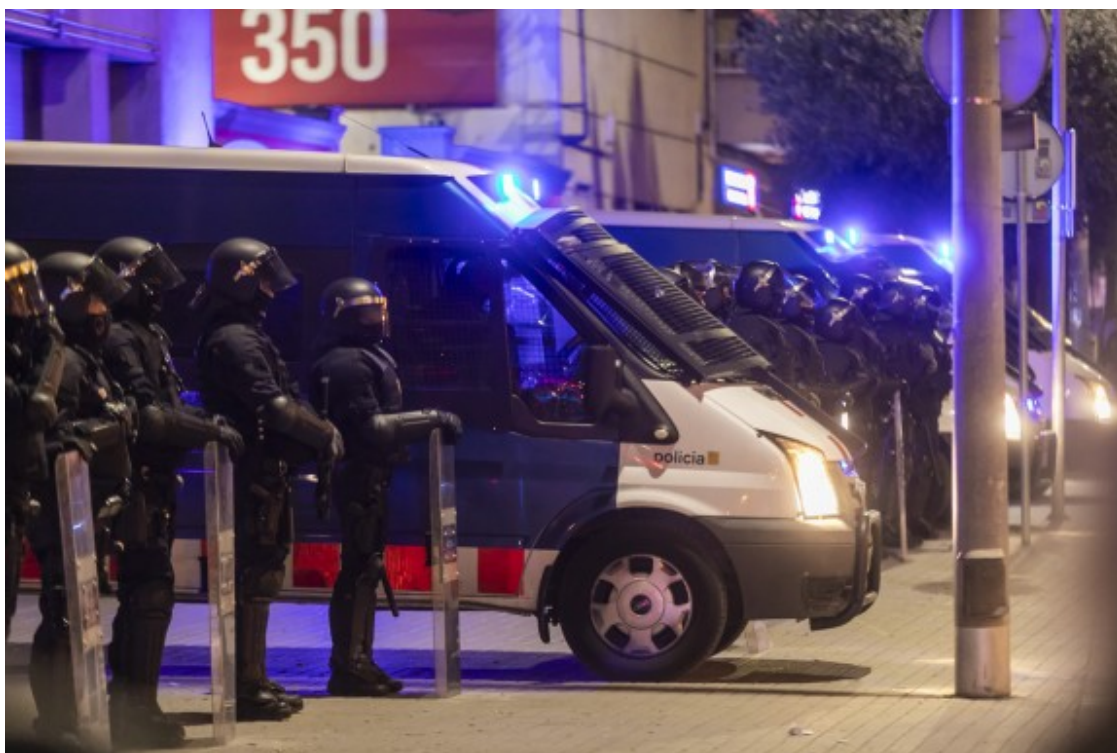
La línia policial custodiant la comissaria espanyola