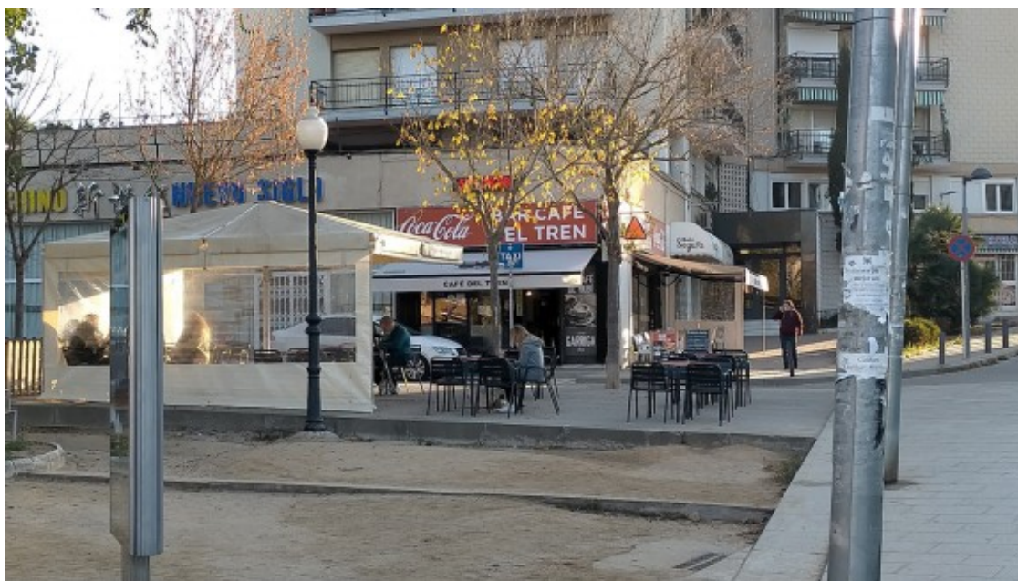
Els bars reobren amb restriccions

Per la seva banda, el Johan del Cafè Central de Terrassa, ha explicat que estan tenint molta feina. "Es nota que els bars fan falta". Les setmanes que han estat tancats assegura que tot i tenir gent que venia a buscar el cafè "però el consum no és el mateix".