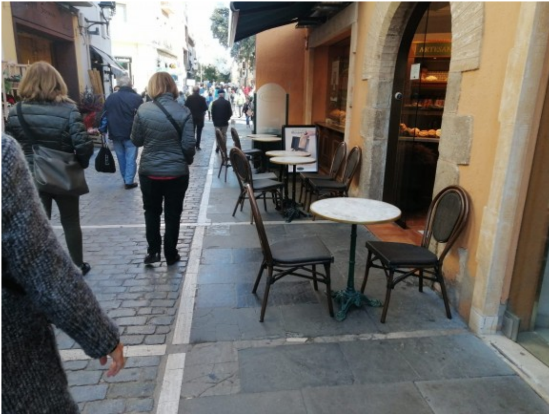
Terrasses buides al carrer Santa Maria de Sant Cugat.

A la plaça d'Octavià, nucli urbà de Sant Cugat, els propietaris d'un cafè confien en què aquesta "última oportunitat" que els han donat duri el màxim de temps possible. "Ja no tenim més diners. Ho hem invertit tot per mantenir el negoci i no ens podem permetre tornar a tancar", relata mentre escombra entre les taules. Confia que la ciutadania respongui a la crida del sector i vinguin a consumir, però tem que la població no ho acabi de fer per por als contagis i l'inici del fred.