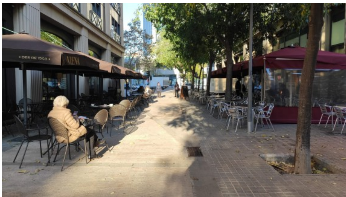
Terrasses d'alguns bars a Sabadell el primer dia de la reobertura.

Tal com ha explicat, s'ha seguit al detall totes les mesures "i hem estat estona col·locant taules i definint distàncies?". A l'establiment hi treballen habitualment nou persones, però ara en són quatre, i la resta estan sota un ERTA que continuaran així i a l'espera de com evoluciona, tant les decisions que puguin prendre com la resposta de la clientela.