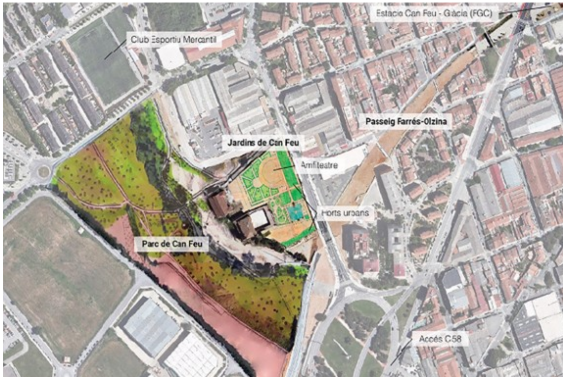
La proposta de l'estudiant sobre el castell i el seu voltant