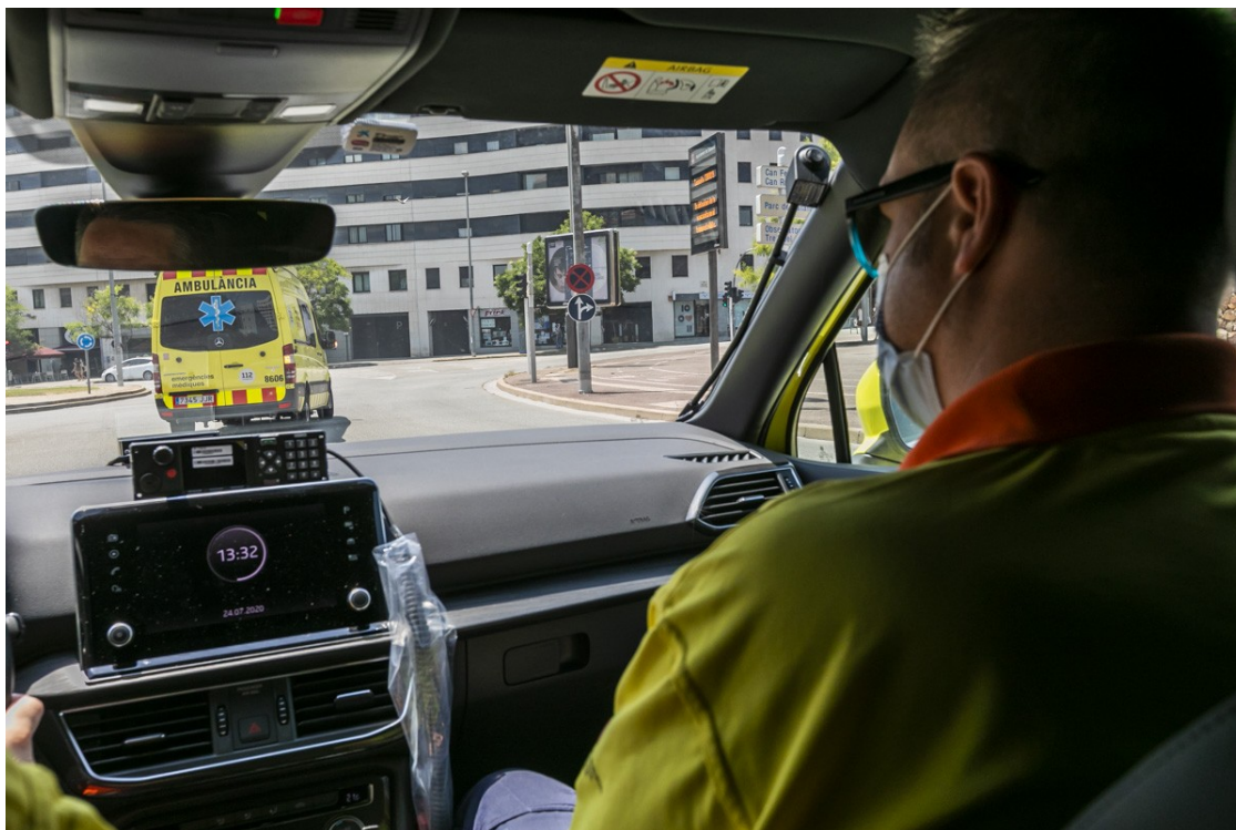
Una ambulància del SEM en camí d'una incidència

NacióSabadell viu una jornada amb el personal d'aquest àmbit sanitari