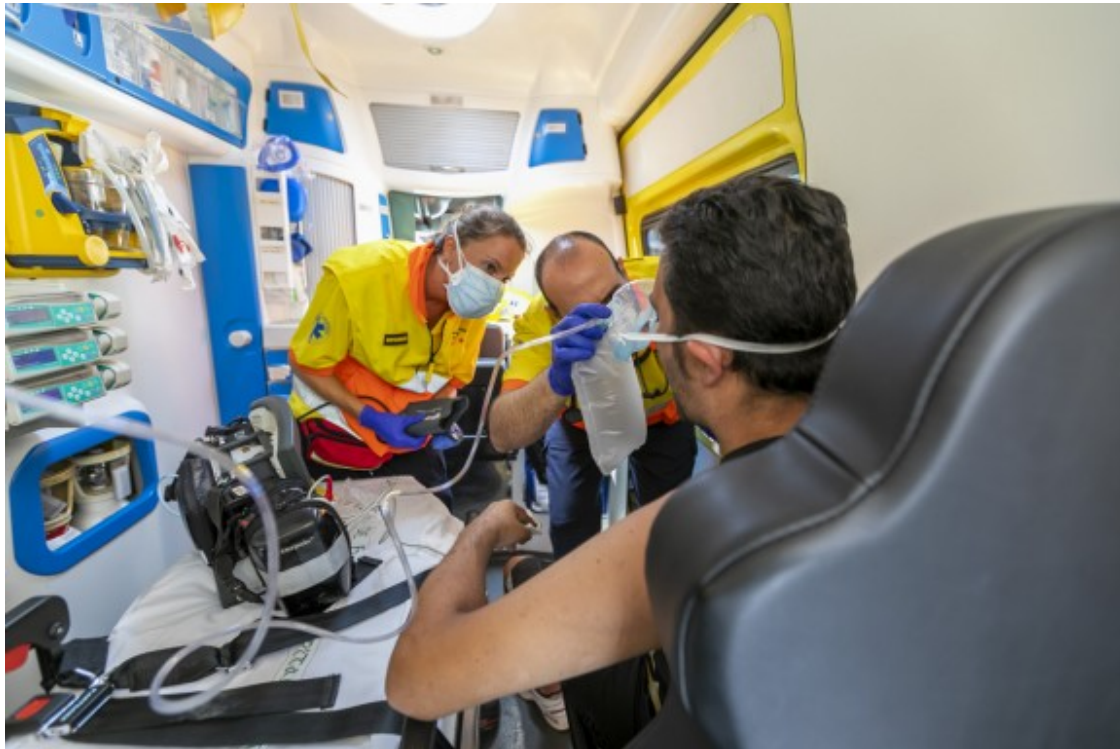
El metge i la infermera assistint la persona ferida