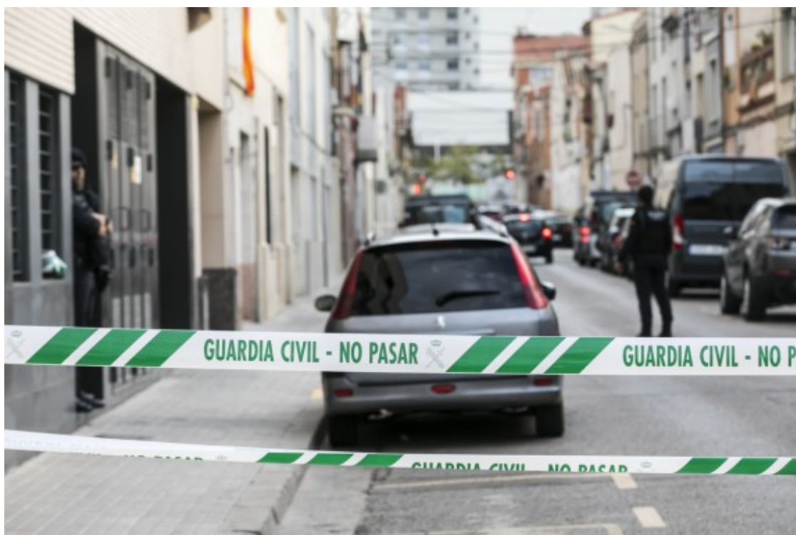
L'operatiu de la Guàrdia Civil, als voltants de la plaça de les Dones del Tèxtil

En el cas del David i la Clara, veïns de Sabadell que van ser detinguts, tal com ha indicat Pellicer, "no van passar a disposició judicial i faltava aquest tràmit" i ha atribuït la seva citació per aquest fet.