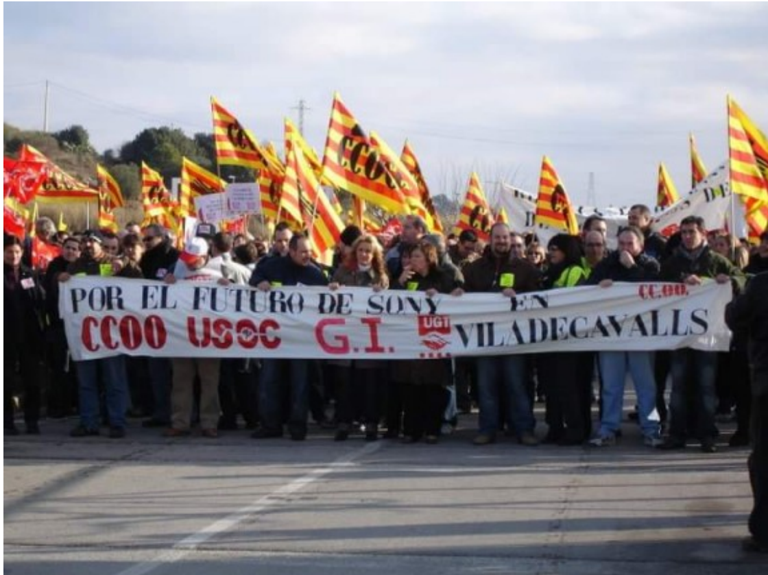
Mobilitzacions dels treballadors de Sony de Viladecavalls.

història d'èxit de la reconversió industrial, precisament d'una altra multinacional japonesa: el de la Sony de Viladecavalls (Vallès Occidental) l'any 2010. La plantilla va deixar de fer televisors per passar a fabricar component automobilístics. Es van salvar un miler de llocs de feina.