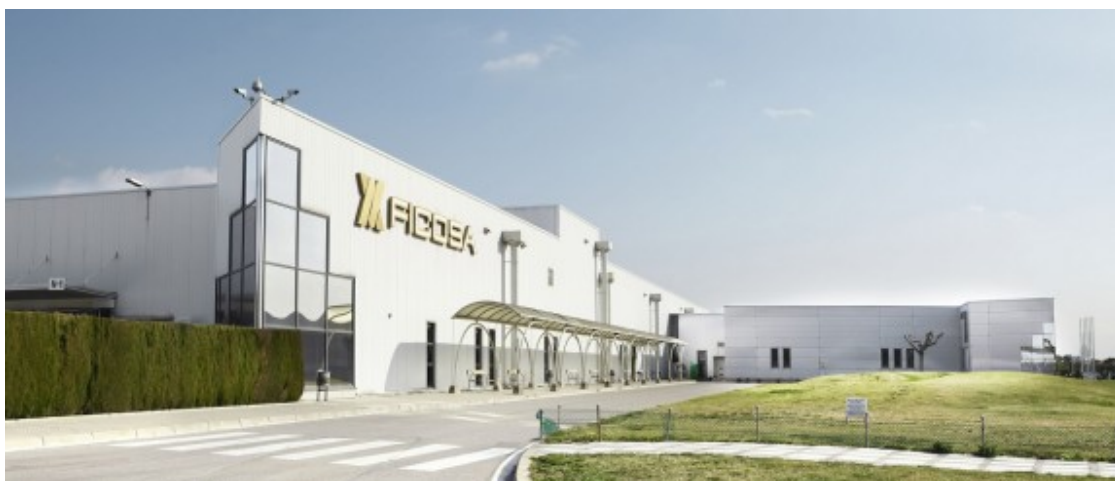
La planta de Ficosa a Viladecavalls.

Les administracions tant de la Generalitat com de l'Estat "haurien de fer una aposta política clara i buscar sinergies perquè Catalunya es converteixi en un referent de la mobilitat sostenible". "Catalunya no pot perdre aquesta oportunitat", conclou Ramos.