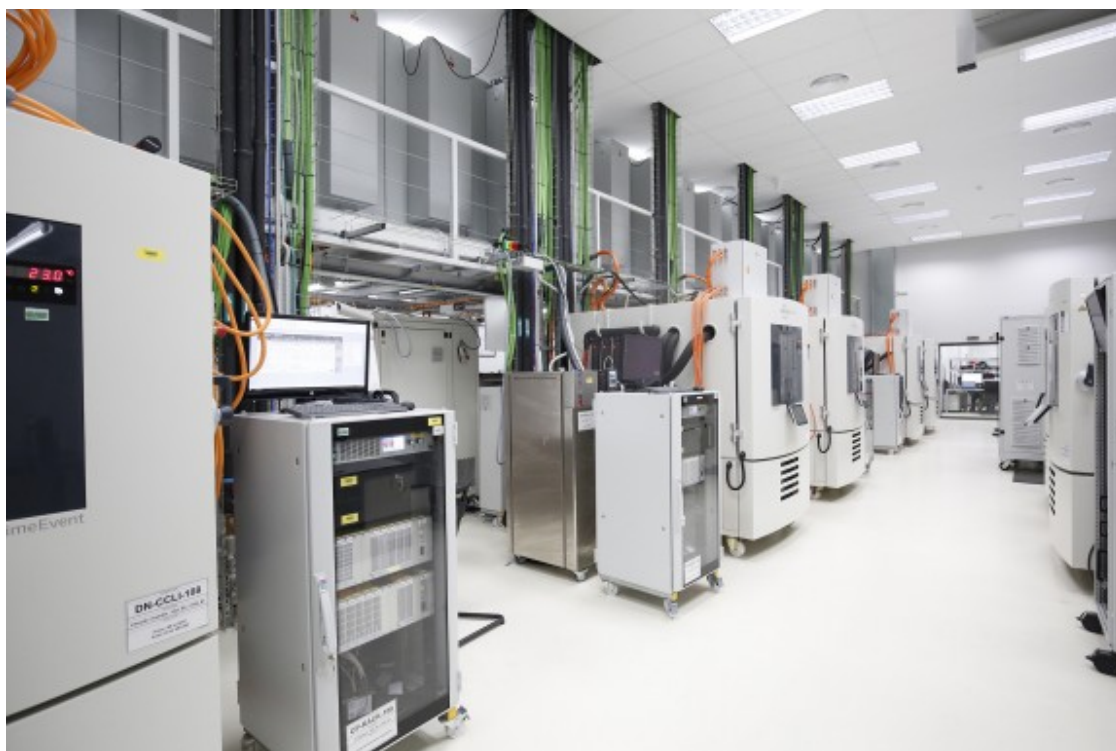
Interior del centre pioner en tecnologia per a la mobilitat elèctrica de Viladecavalls

"El principi de la reconversió va ser molt suau i a mesura que avançava va ser molt dur veure que sobrava gent". L'aposta que feia Ficosa per l'electrificació dels cotxes era un nou producte enmig d'una gran crisi i "generava moltes incerteses" a tot el sector, apunta el líder sindical de CCOO.