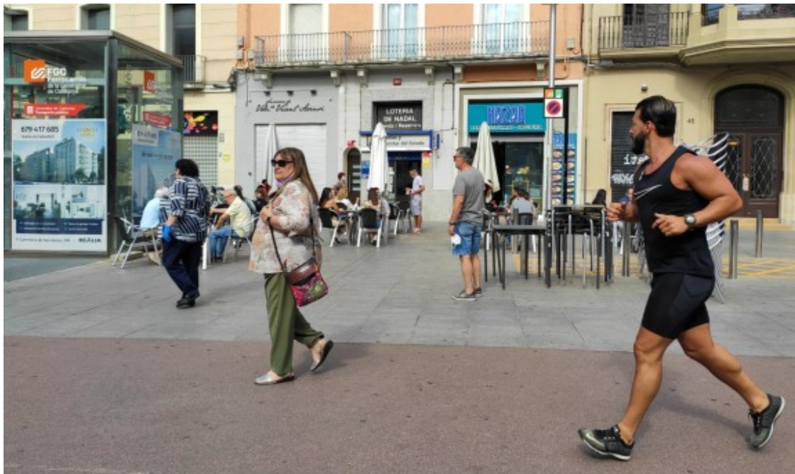
Les terrasses amb les separacions per seguretat

Ell, igual que el gerent del Bar La Oficina?, uns metres més enllà, que manifestava il·lusionat de tornar a obrir, però amb la incertesa del client i d'ampliar o no ampliar espai, han tornat a l'activitat dos mesos després. Francisco assegura que retirarà l'Expedient de Regulació Temporal d'Ocupació (ERTO) d'una de les dues persones contractades i a l'altra la posarà a mitja jornada.