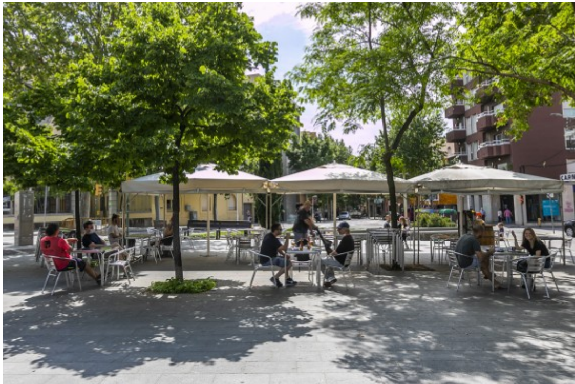
La distància entre les taules a la plaça de la Creu Alta