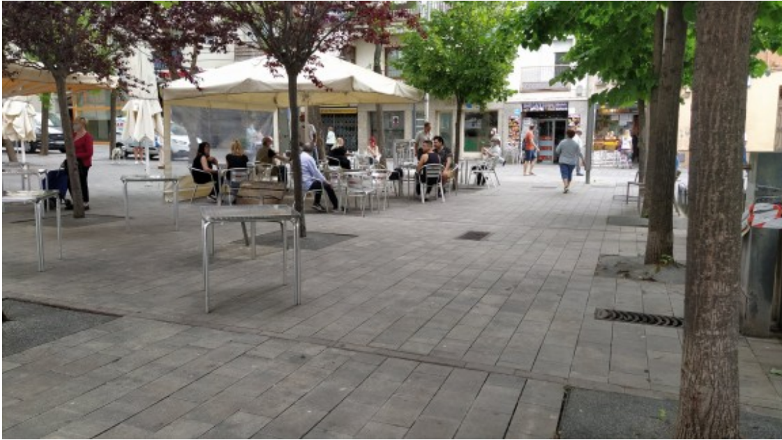
Reobren algunes terrasses de bars a Rubí

Respecte al pagament de la taxa, que l'Ajuntament de Rubí va anunciar que se suspenia per aquest any 2020, alguns propietaris han explicat que ja la van liquidar el mes de febrer, però que el Consistori està estudiant la fórmula per tal de compensar-los-ho.