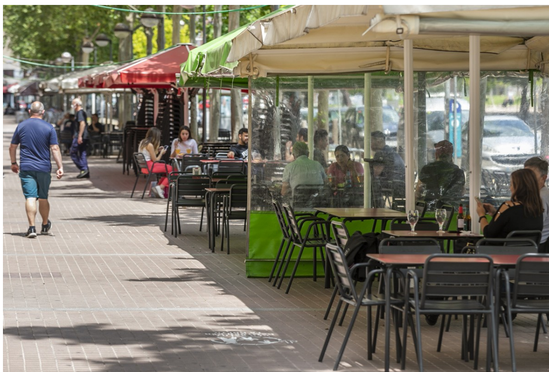
L'aspecte de les terrasses el dia de la reobertura | Juanma Peláez

La prudència i les ganes de tornar a seure en una terrassa es combinen en un matí amb molts bars encara pendents d'obrir a les principals ciutats del Vallès Occidental