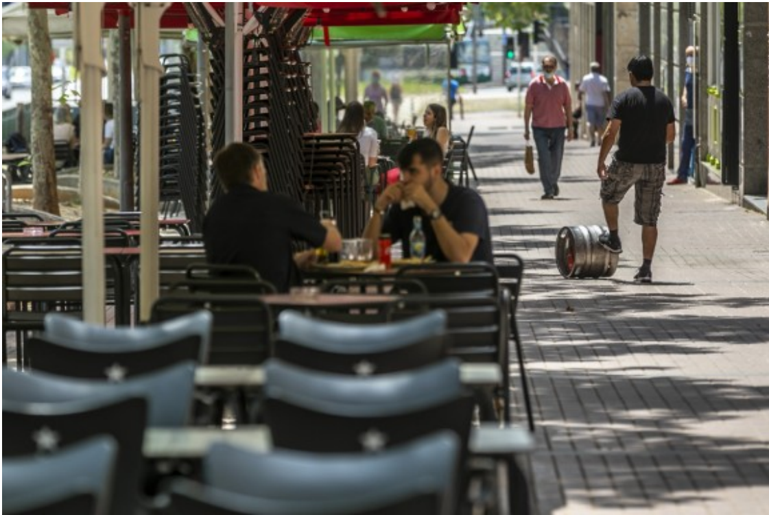
Els negocis de restauració de l'Eix Macià

¿Em conformo que aquest any no perdi diners?, expressa. I una línia molt semblant, Scheamus, del Nazar al Passeig, ¿hi havia ganes de consumir i seure a la terrassa? i veu una mica més d'optimisme els números del negoci. A diferència del que s'ha produït en altres zones quan han arribat a la fase 1, la ciutadania no ha omplert les taules i tampoc s'han vist cues en les primeres hores d'obertura.