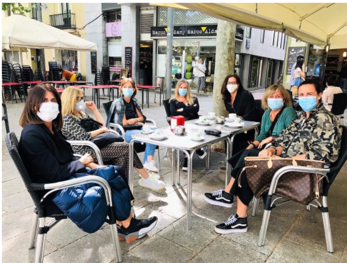
Les terrasses obren amb aforament limitat a la fase 1 a Terrassa.