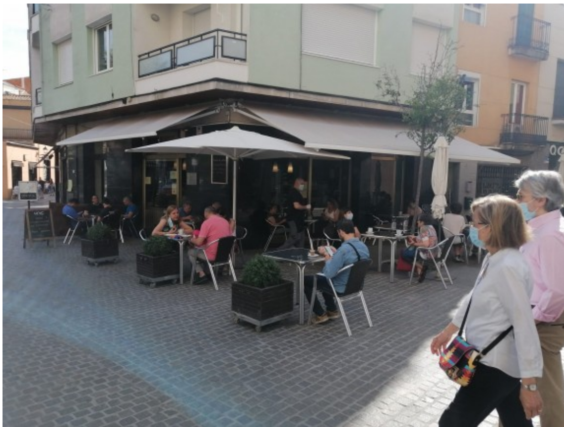
Sant Cugat entra a la fase 1 del desconfinament amb la reobertura dels bars de la ciutat

Per la seva banda, el Xavi, propietari del bar "Febrer" a la plaça de Barcelona, explica que ha presentat una instància a l'Ajuntament per augmentar l'espai de la terrassa i poder mantenir el mateix nombre de taules assegurant el compliment de les distàncies de seguretat. Consistoris d'altres municipis del país, han permès als bars i restaurants ampliar l'àrea d'ocupació de la via pública mentre duri la crisi del coronavirus.