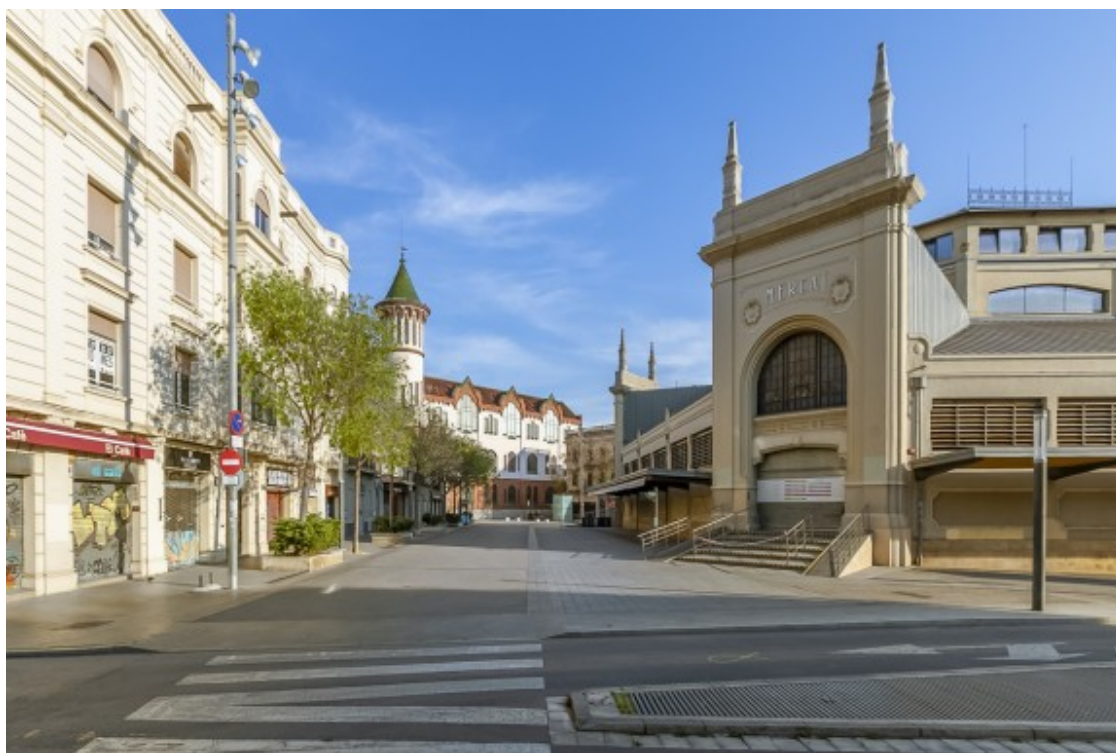
El Mercat Central

Aprofitant la investigació i innovació amb la Universitat Autònoma de Barcelona (UAB) a la ciutat i l'Hospital Parc Taulí, que Gràcia i Can Feu esdevinguin districtes tecnològics?, amb la finalitat de diversificar l'economia.