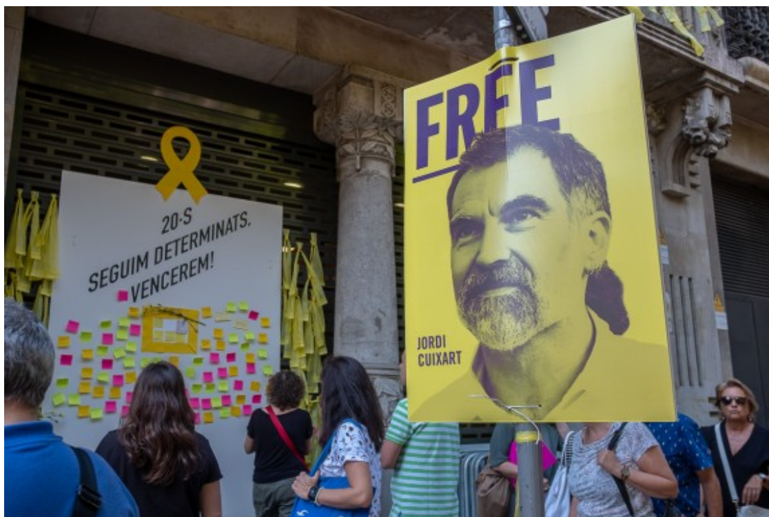
Primer aniversari del 20-S al Departament d'Economia.

- Què està fallant? Vostè prefereix no mirar enrere, no qüestionar-se què es va fer malament o qui n'és responsable, però la manca d'anàlisi compartida és un hàndicap per no posar-se ara d'acord en el com?