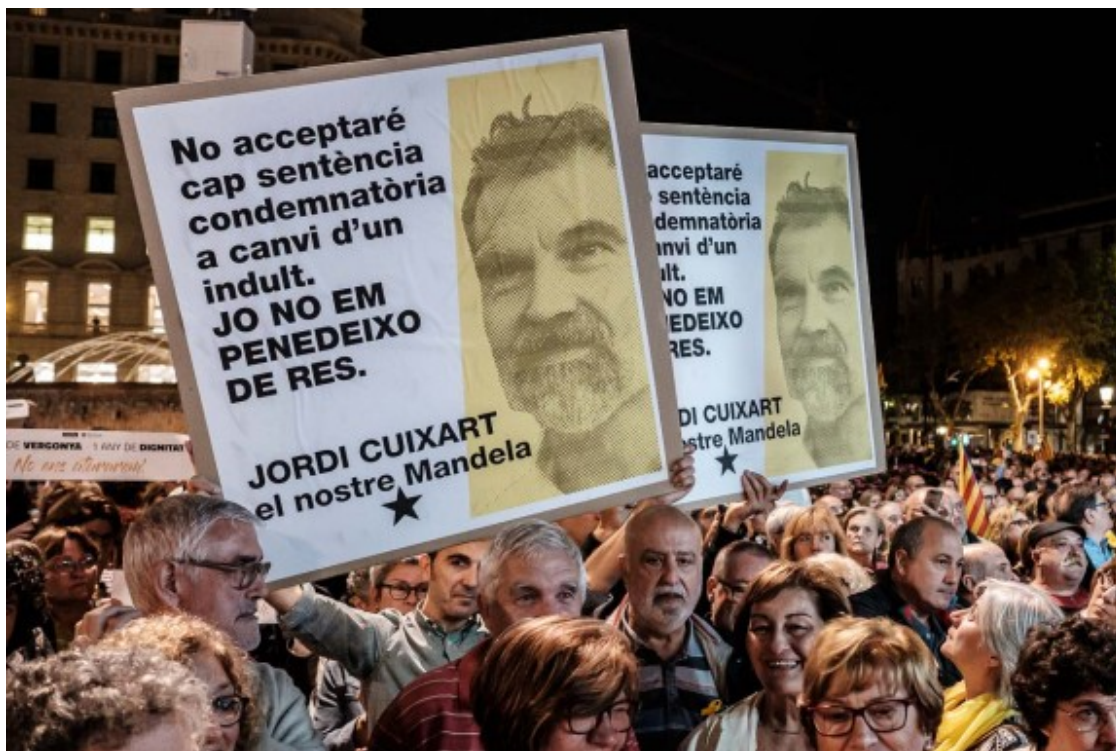
Cartells amb el rostre de Jordi Cuixart, en una manifestació a plaça de Catalunya.

estèrils, com quin paper havia de jugar cadascú a la manifestació. Ara cal tenir-ho present. Si passa el mateix que el 2010, pot succeir que tot canviï al voltant dels partits. El que no canviarà és la societat catalana. La sentència serà una prova de foc per als partits polítics. Més enllà dels pactes, caldrà respondre atenent aquestes grans majories. S'ha acabat el temps de les ambigüitats: la inacció els passaria factura.