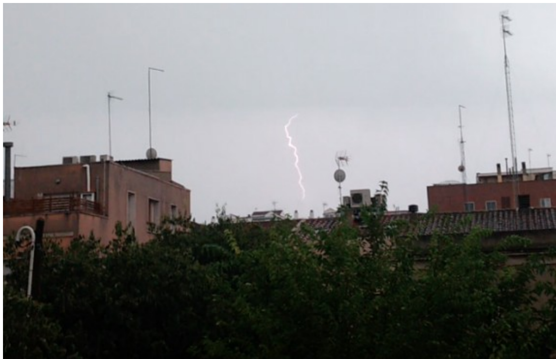
Llamp a Sabadell, aquest dimecres.

De fet, el Meteocat preveu que durant el vespre és probable que les precipitacions arribin al nord de Ponent així com a punts del litoral i prelitoral central. Els xàfecs seran d'intensitat entre feble i moderada o localment forta. Sovint aniran acompanyats de tempesta i és probable que localment de calamarsa. S'acumularan quantitats de precipitació entre minses i poc abundants o localment abundants.