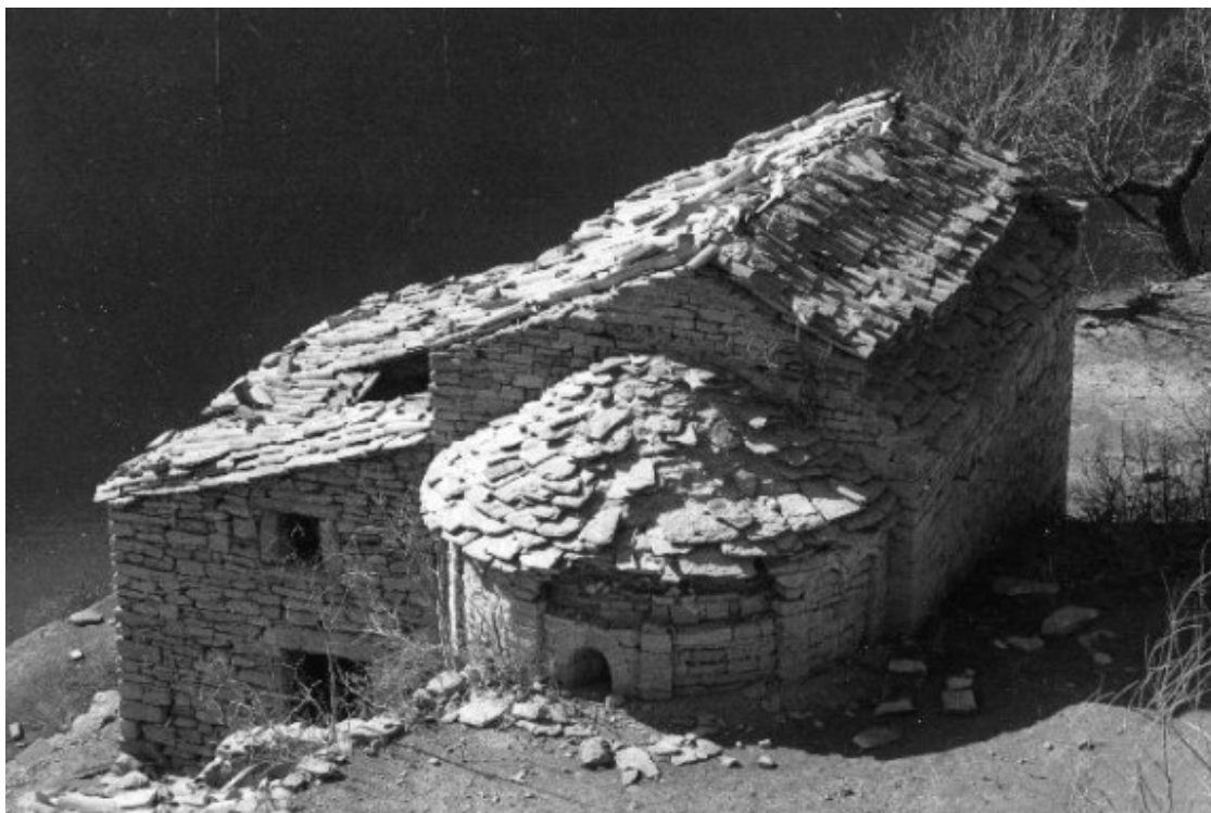
Sant Vicenç de Verders.