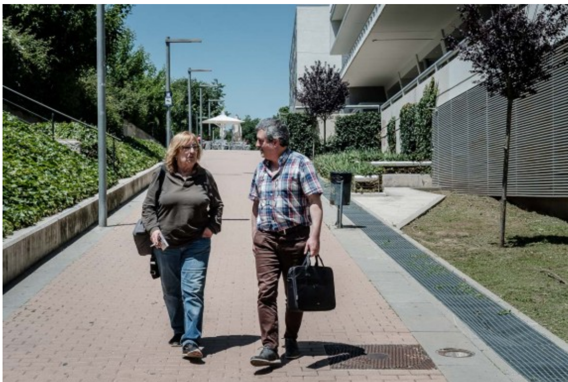
L'autora després de la conversa amb NacióDigital.

- A Catalunya i a l'estat espanyol. Ha guanyat més diners el traductor nord-americà de Borges que el mateix Borges. A Europa no ho sé. Són els Estats Units els qui marquen la pauta. A mi m'agrada la traducció perquè jo el que soc és lectora. Un lector és un traductor. Si tu llegeixes un poema meu, tradueixes del meu codi al teu. El traductor és el lector privilegiat, més aprofundit.