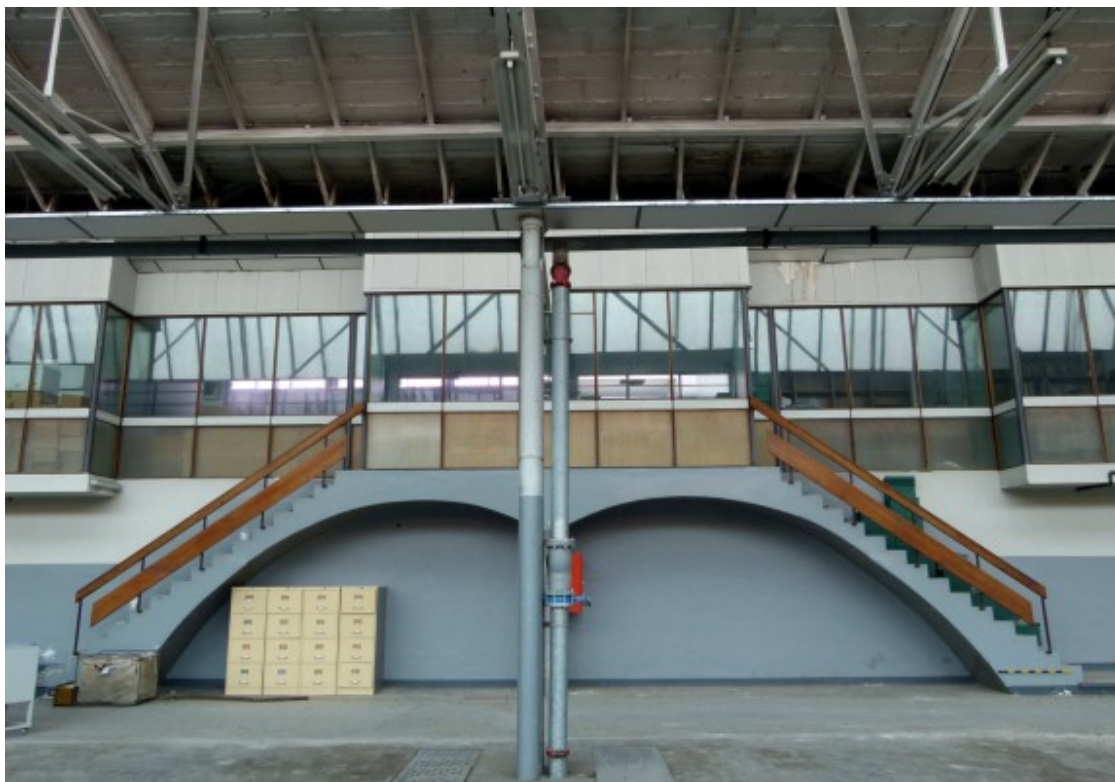
Les escales que donen pas a la sala per controlar tota la nau

- És cert que hi havia túnels que unien Artèxil ( https://www.naciodigital.cat/sabadell/noticia/19537/passadissos/secrets/armes/monstre/misteris/clavegueram/sabadell ) amb, per exemple, Can Marçet?