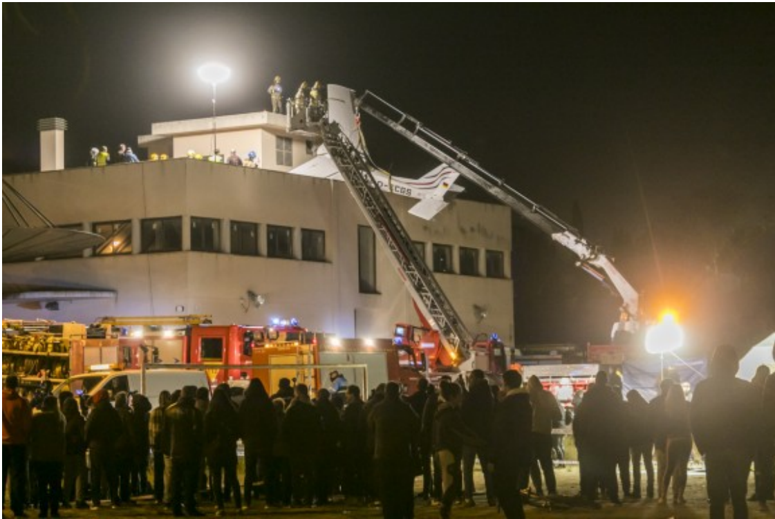
L'avioneta accidentada a Badia.