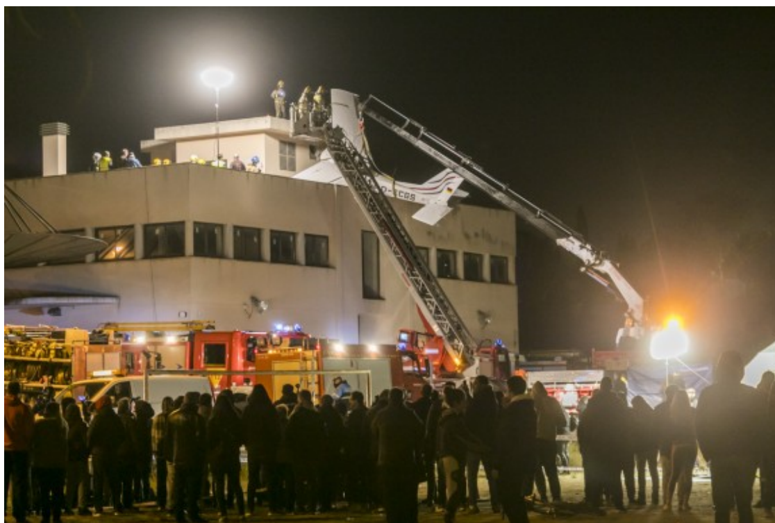
L'avioneta accidentada a Badia.