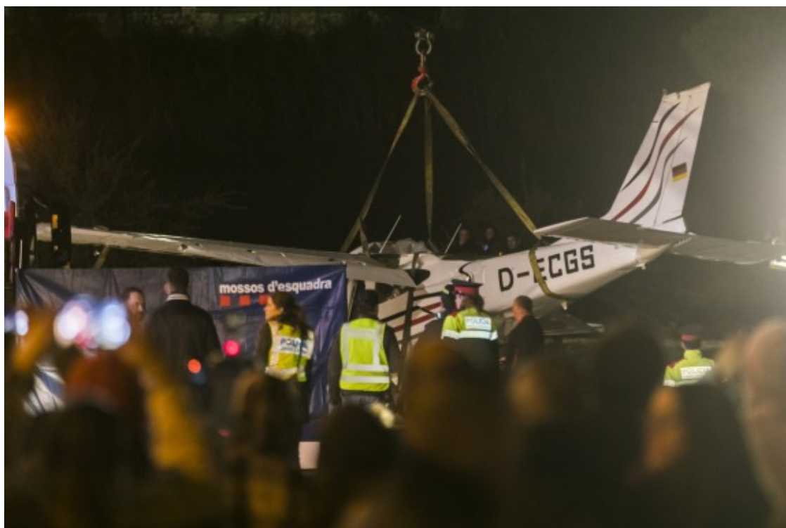
L'avioneta accidentada a Badia.