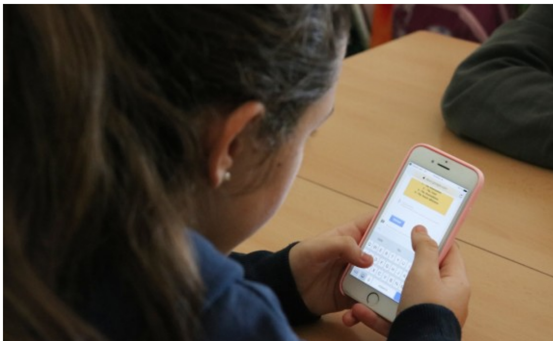
Una alumne de l'INS Torre del Palau fent ús del telèfon mòbil

amb "finalitats concretes". Un exemple és el projecte per desenvolupar noves aplicacions per telèfons mòbils en el marc del programa mSchool de la Generalitat o altres àmbits com la robòtica. També els fan servir en altres assignatures troncal com les llengües. "A classe d'anglès fem servir el mòbil per enregistrar converses i fer vídeos", explica Sergi Folch, un estudiant de quart d'ESO que indica que fer servir el mòbil els ajuda.