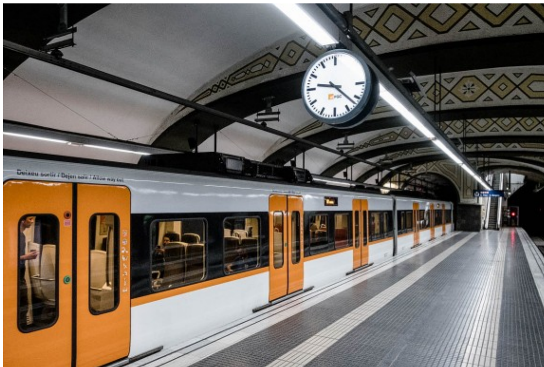
Estació de FGC de plaça Catalunya.

S'oferirà servei d'autobús substitutori en els diferents trams afectats