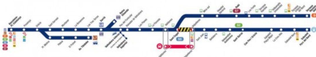
Talls de serveis en els FGC al Metro del Vallès

De l'altra, el divendres dia 15 a partir de les 22h i els dies 16 i 17 de juny s'interromprà el servei d'un tram de la línia S2 (Sabadell) d'FGC. El tram afectat pels treballs de millora és el comprès entre les estacions de Sant Cugat i Volpelleres de la línia Barcelona-Vallès. FGC oferirà servei d'autobús substitutori entre les estacions de Valldoreix i Volpelleres.