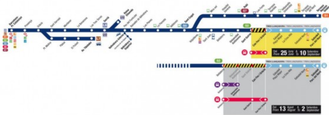
Talls de serveis en els FGC al Metro del Vallès