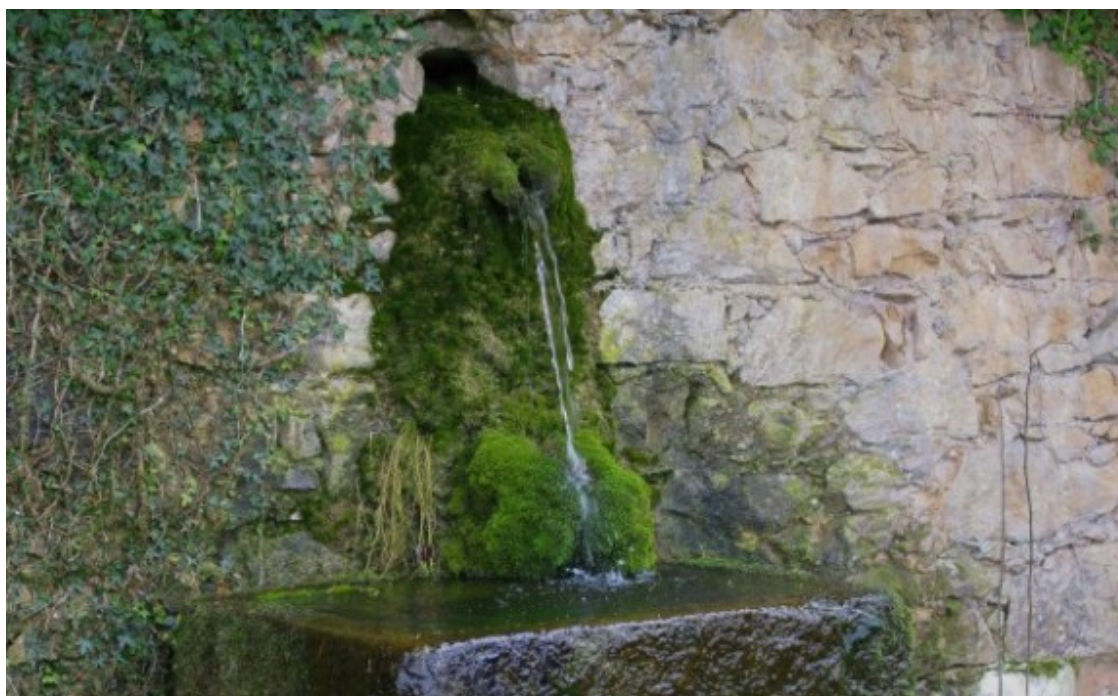
Font de Vilarjoan.