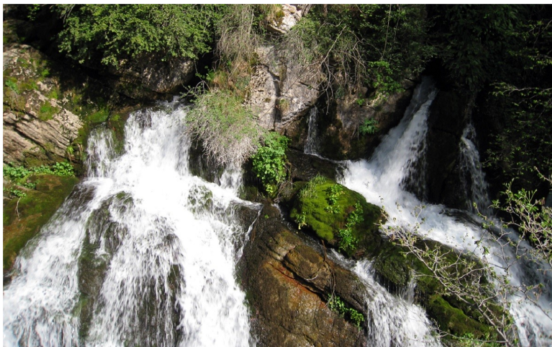
Fons del Llobregat.

La iniciativa té un component interactiu i solidari, ja que els usuaris poden aportar noves fonts per ampliar el recull