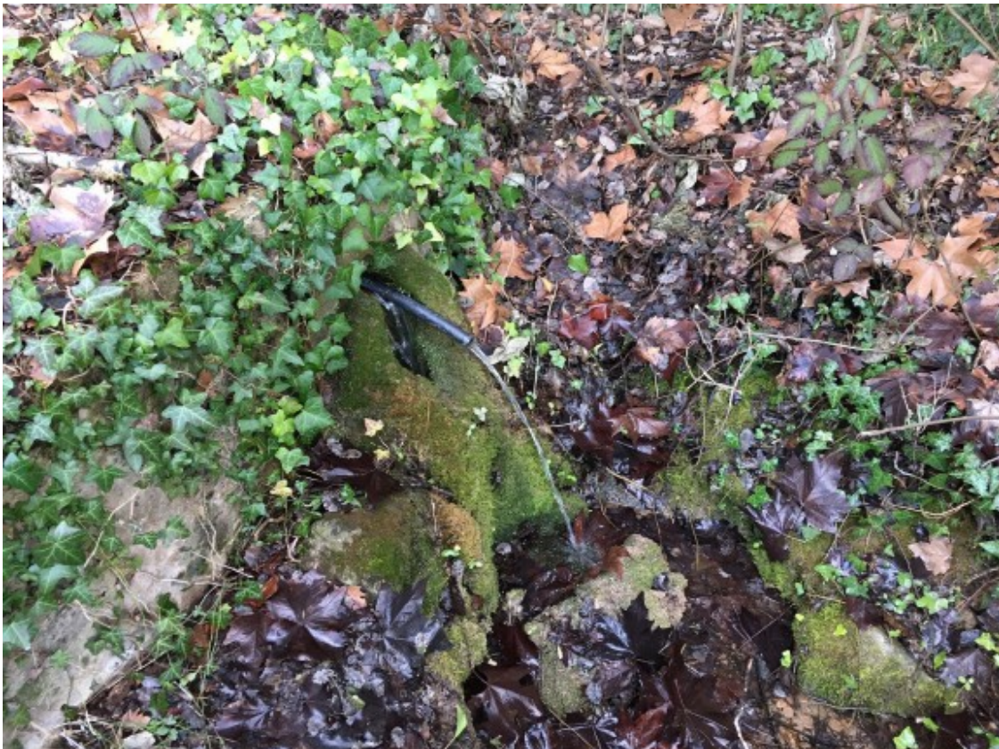
Font del Ti de Prats de Lluçanès.

A l'aplicatiu hi podreu trobar fonts com aquestes: