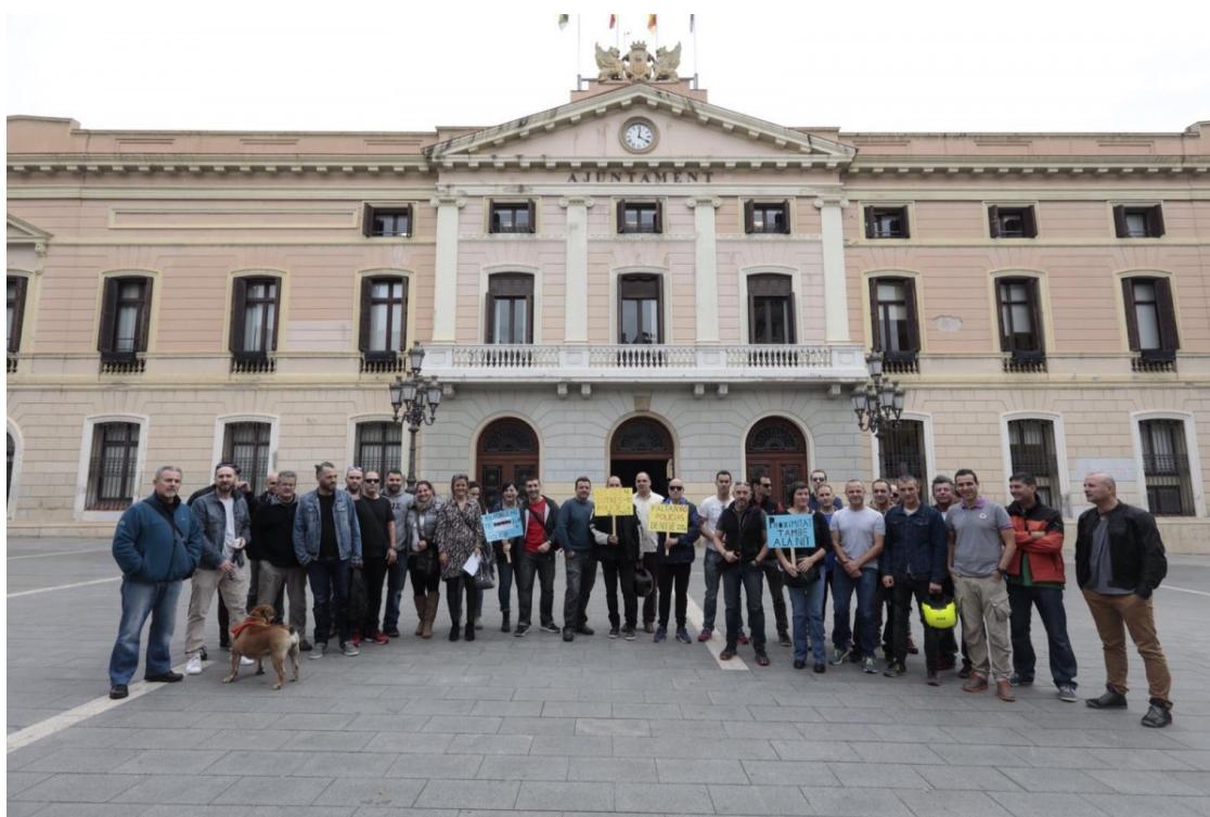
Concentració de policies davant l'Ajuntament de Sabadell.

Ho faran davant l'Ajuntament els dies de ple | Reclamen millores en les condicions laborals