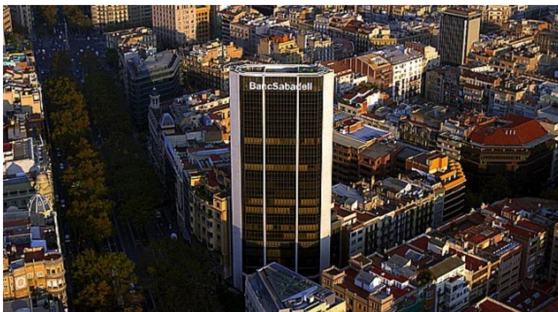
Edifici corporatiu del Banc de Sabadell a Barcelona