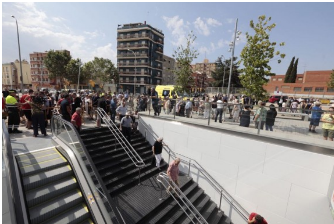
Inauguració de les noves estacions dels FGC de Sabadell.