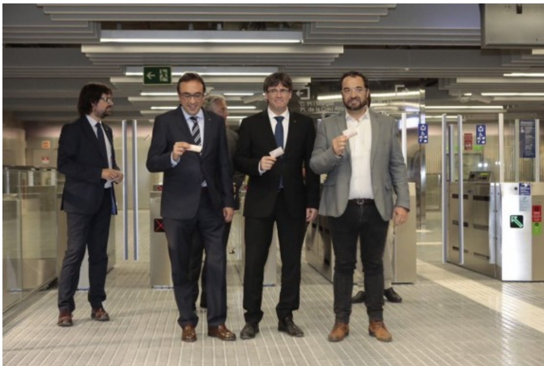
Inauguració de les noves estacions dels FGC de Sabadell.

Acte seguit, autoritats i convidats han agafat el tren, passant de llarg de Sabadell Nord, per arribar a Sabadell Parc del Nord, on s'ha fet l'acte oficial d'inauguració del perllongament.