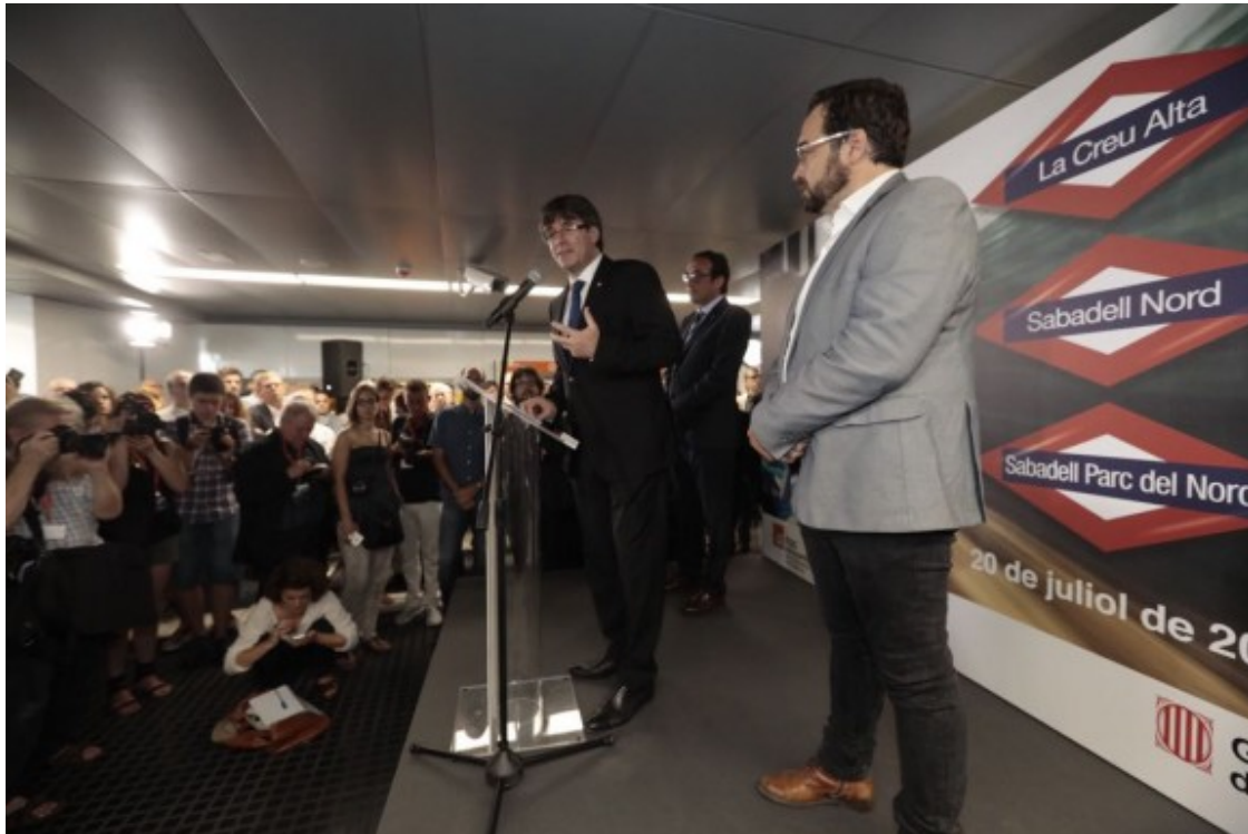
Inauguració de les noves estacions dels FGC de Sabadell.

El titular de Territori i Sostenibilitat ha recordat els seus antecessors ¿per haver fet possible aquesta construcció?: Joaquim Nadal, Lluís Recoder i Santi Vila. Fent menció especial a Recoder per venir a Sabadell a dir que s'aturaven les obres. Rull ha comparat la feina del Govern amb la de l'Estat. ¿Del 2011 al 2017 hem fet 30 kilòmetres de noves vies i 27 noves estacions?, mentre que des de Madrid ¿des del 1978 al 2017, zero kilòmetres en xarxa de Rodalies i cinc noves estacions?. Ha pronosticat que amb aquest allargament, Sabadell tanqui 2017 amb 2,7 milions d'usuaris i preveient que superi els quatre milions el 2021.