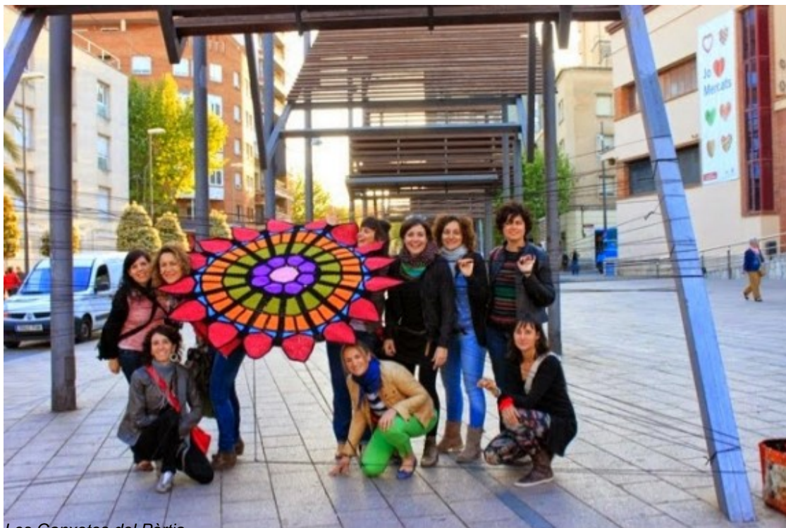
Les Ganxetes del Pòrtia.